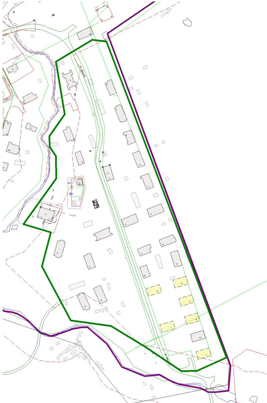
СХЕМА границ проектирования