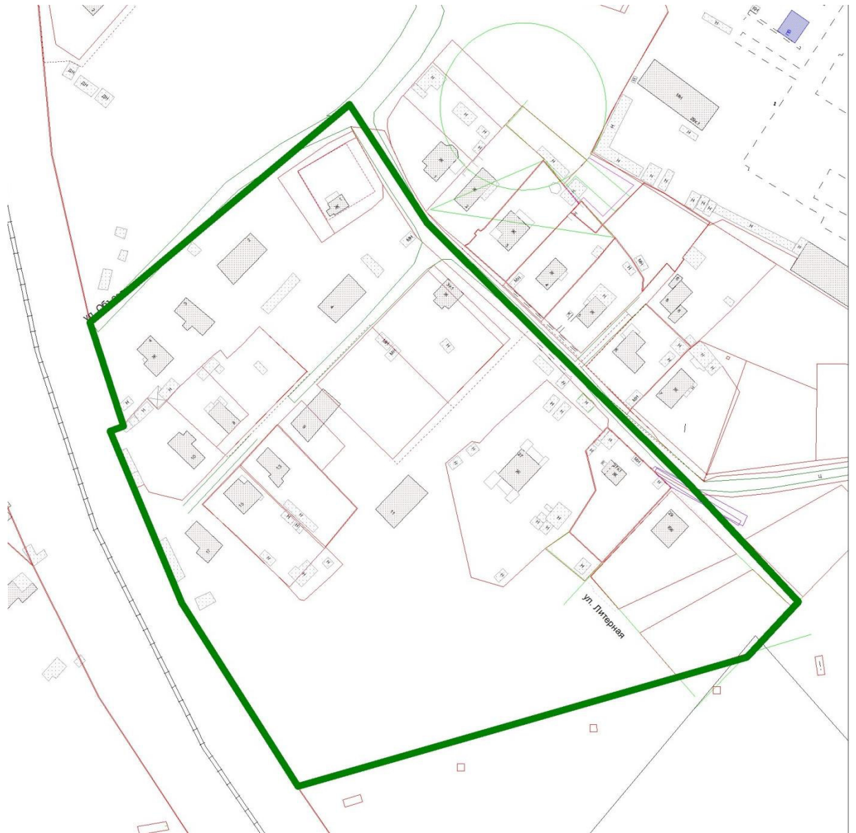
СХЕМА границ проектирования