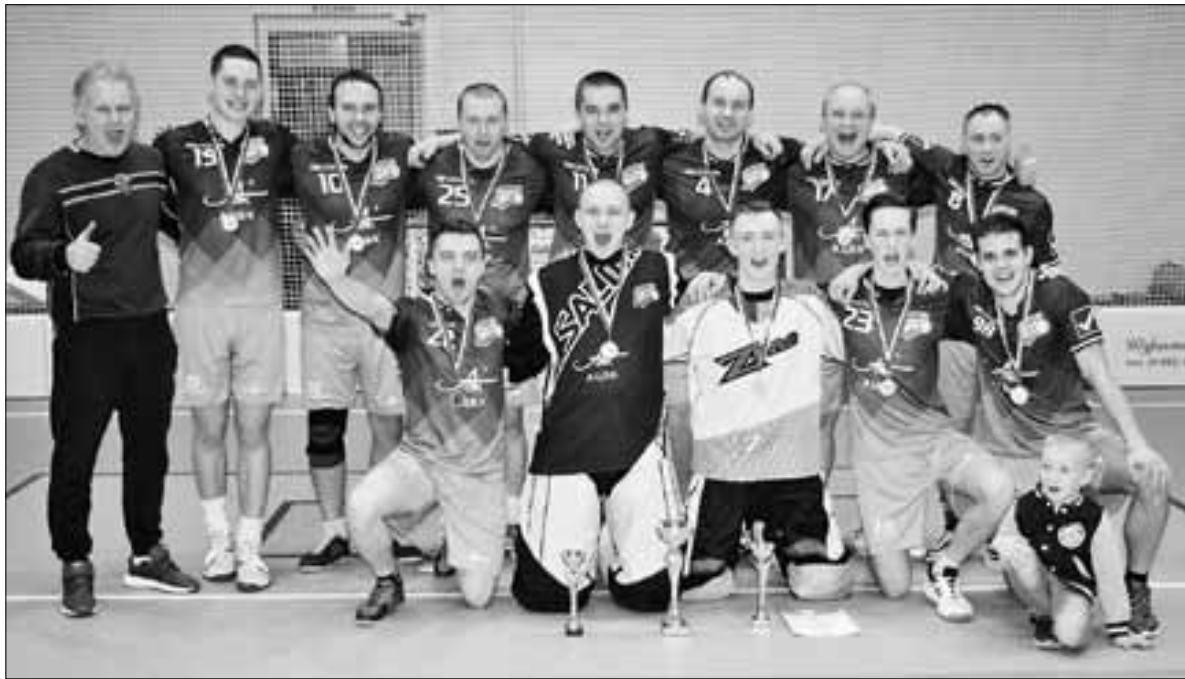
■ «Двина» (Новодвинск) – чемпион Архангельской области.

– Это хороший новогодний подарок для всех архангелогородцев и гостей областного центра. В нашем регионе очень много ценителей русского хоккея. Поэтому в нашей стране нельзя найти лучшего места, чем Архангельск, где при легком морозце могут сыграть две лучшие команды России.