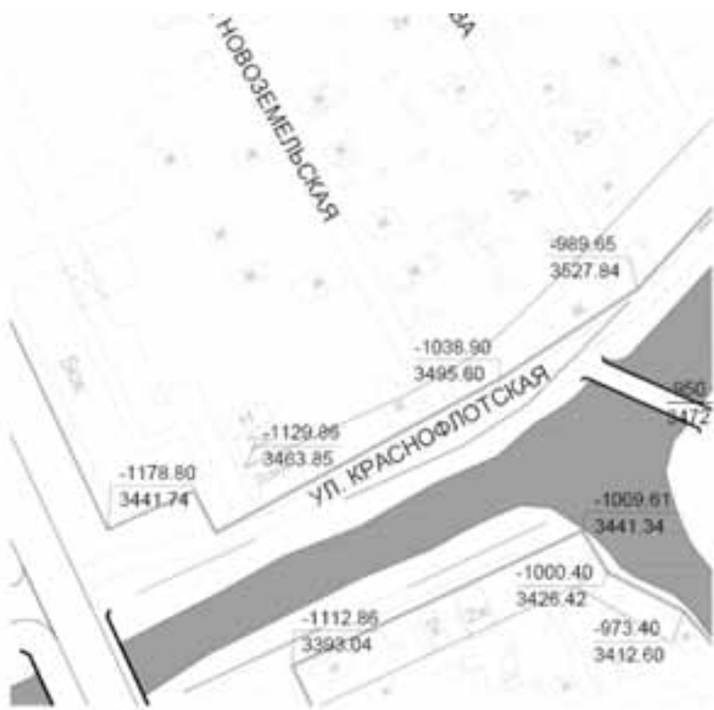
Приложение № 4

размещение площадок общего пользования различного назначения за границами земельных участков (на земельных участках с кадастровыми номерами 29:22:040616:9, 29:22:040616:10, 29:22:040616:21).