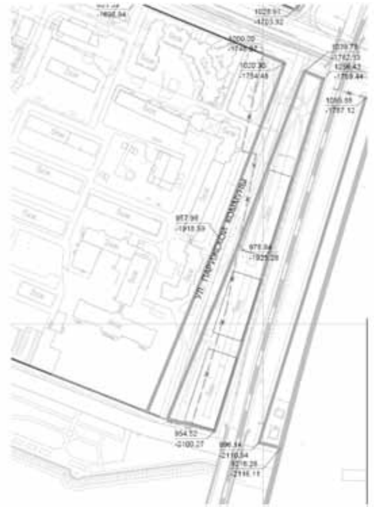
Приложение № 2

Предложение по внесению изменений в проект планировки центральной части муниципального образования "Город Архангельск" в границах ул. Смольный Буян, наб. Северной Двины, ул. Логинова и пр. Обводный канал, в части корректировки красных линий в районе ул. Парижской коммуны в Ломоносовском территориальном округе г. Архангельска