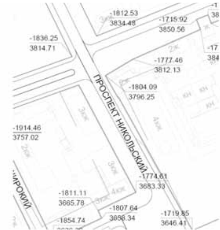
Приложение № 5

Предложение по внесению изменений в проект планировки района "Соломбала" муниципального образования "Город Архангельск" в части корректировки красных линий в районе пр. Никольского и ул. Маяковского в Соломбальском территориальном округе г.Архангельска