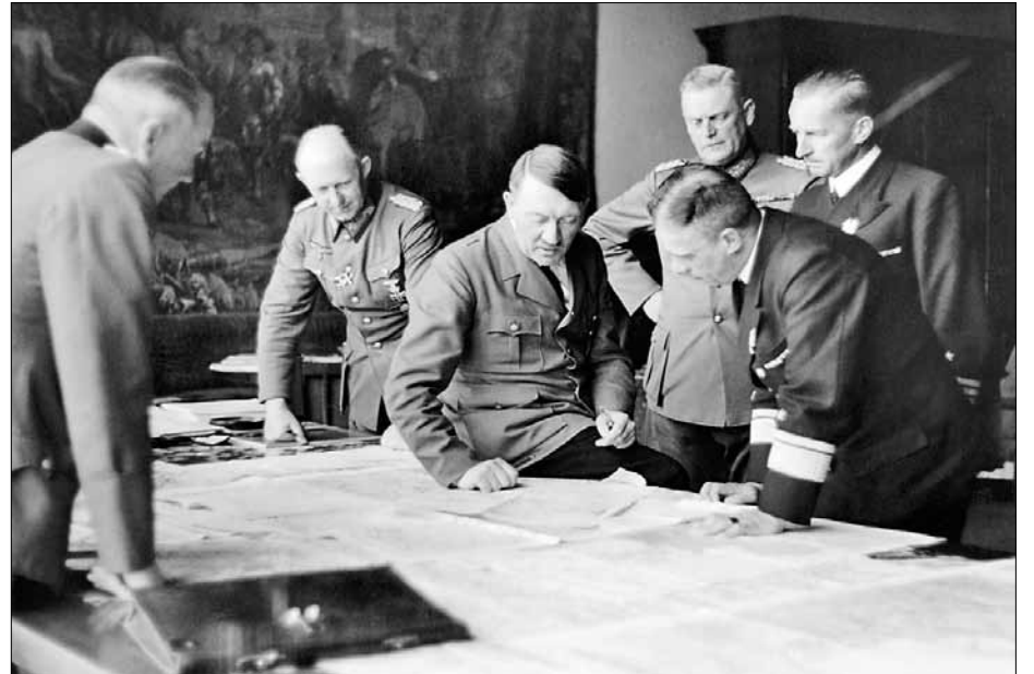
■ А. Гитлер и главнокомандующий кригсмарине гросс-адмирал Э. Редер