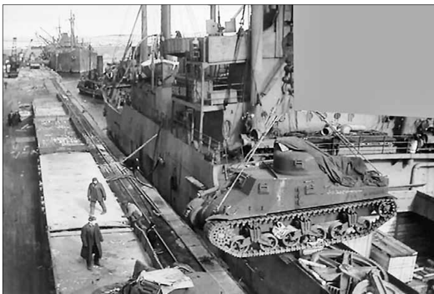
■ Разгрузка судов союзных конвоев