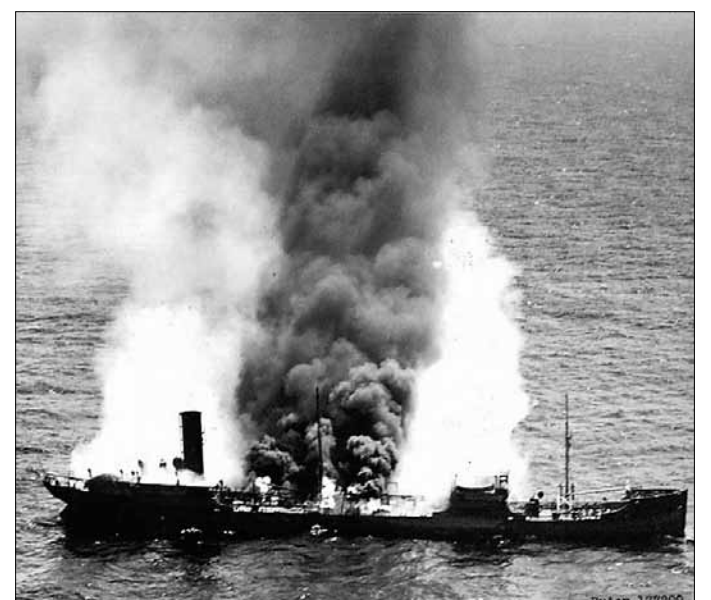
■ Гибель транспорта в Северной Атлантике

мутся за дело всерьез, то они атакуют северную Норвегию в нескольких местах. Нанесут совместный удар силами армии и флота, попытаются вытеснить нас оттуда, если удастся, взять Нарвик, а затем оказывать оттуда давление на Швецию и Финляндию. Германский флот должен использовать все свои силы для обороны Норвегии. Поэтому туда необходимо перебросить все линейные корабли и крейсера. Линкоры «Scharnhorst» и «Gneisenau» вместе с тяжелым крейсером «Prinz Eugen» целесообразно вывести из Бреста через Ла-Манш используя внезапность и плохую погоду». Редер доложил о том, что линейный корабль «Tirpitz» будет готов к переходу в Тронхейм к 10 января для последующих действий против союзных конвоев, следующих в Архангельск. Корабли в Бресте будут готовы к выходу в море до 10 января. Гитлер сказал, что примет решение после того, как прояснится ситуация в Норвегии. Однако ее защита должна быть серьезно усилена.