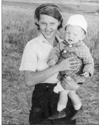
■ Деревня Посохово под Сольцами, Ленинградская область, 22.08.1939 года. Отцу 1 год

История блокадной семьи в воспоминаниях внука