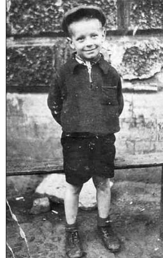
■ Ленинград, май 1945 года, отцу 6 лет