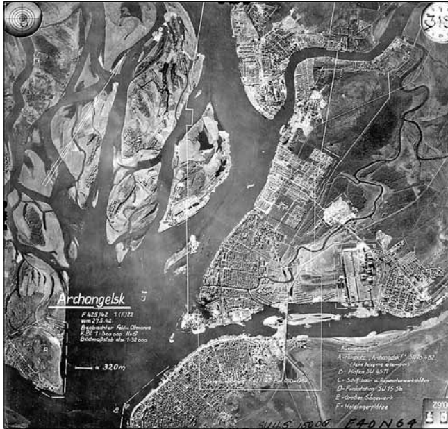
■ Архангельск. Германская аэрофотосъемка

А. Гитлер на совещании в Вольфшанце сказал начальнику штаба верховного главнокомандования вермахта генерал-фельдмаршалу В. Кейтелю и главнокомандующему кригсмарине гросс-адмиралу Э. Редеру: «Если британцы возь-