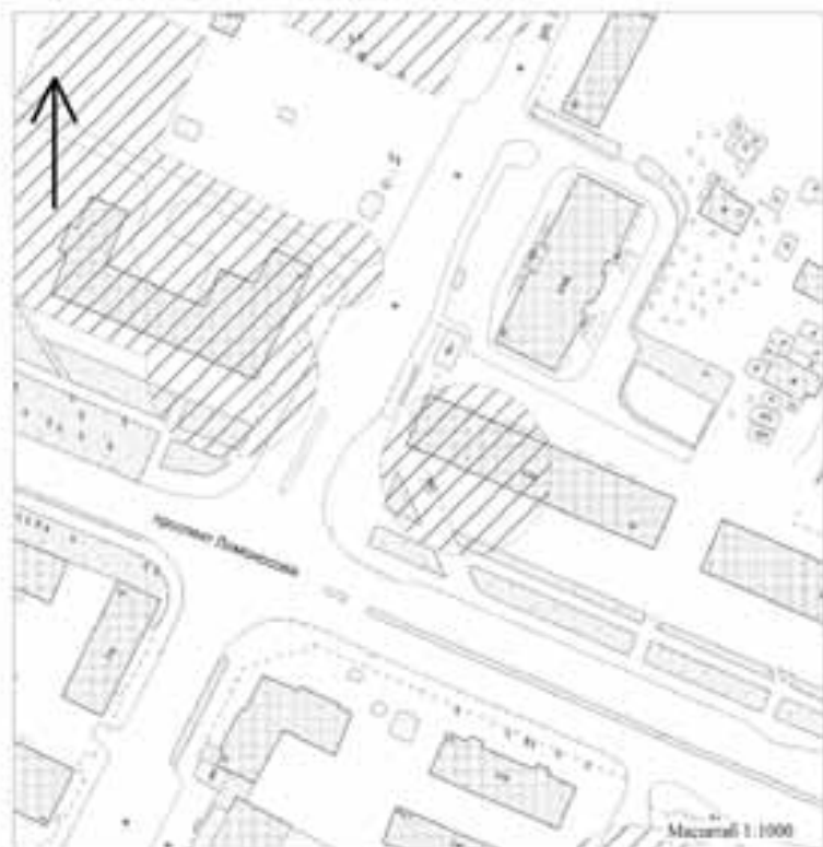
Схема № 211 границ прилегающей территории медицинской организации, расположенной по адресу: Архангельская область, г. Архангельск, пр. Ломоносова, д. 18

Условные обозначения: — граница земельного участка; — граница прилегающей территории, в границах которой не допускается розничная продажа алкогольной продукции.