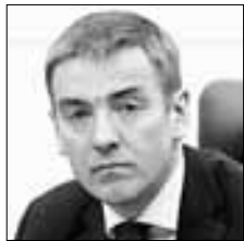
Виктор ЕВТУХОВ Заместитель министра промышленности и торговли РФ в интервью «Российской газете» рассказал об инициативе Минпромторга вернуть на улицы городов торговые палатки и ларьки

«Мы полностью готовы к проведению игр Универсиады: 11 видов спорта будут представлены на играх, будет разыграно 76 комплектов наград <...> Во всех видах спорта мы (спортсмены сборной России) будем претендовать на завоевание медалей любого достоинства»