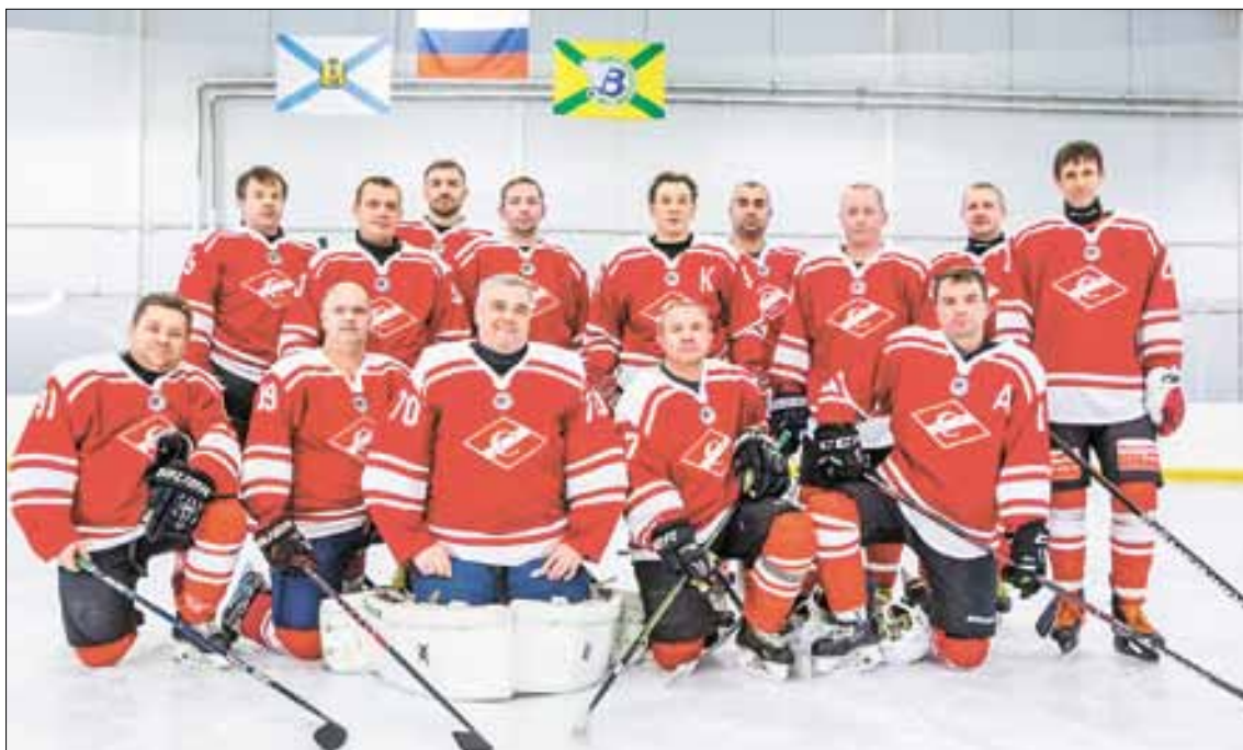
■ Архангельский «Спартак» – лидер дивизиона «Любитель 40+».