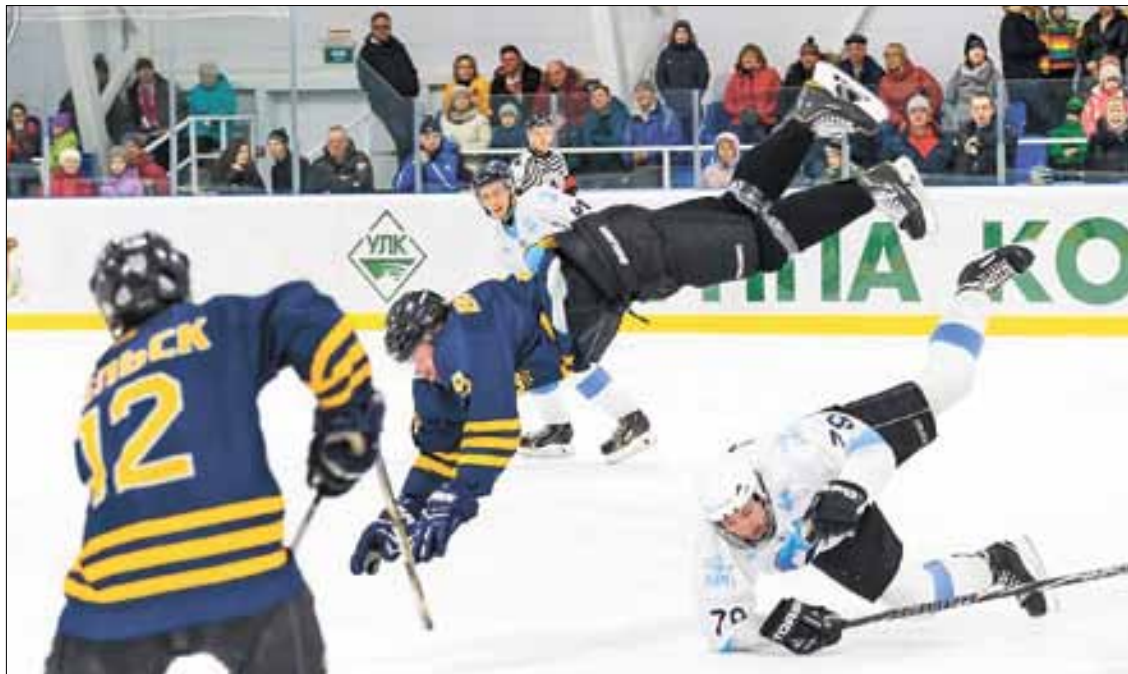
■ Матч ХК «Вельск» – «Ледокол».

– В этом сезоне мы впервые провели региональный этап Всероссийских соревнований юных хоккеистов «Золотая шайба» им. А.В. Тарасова среди сельских команд в двух возрастных группах. В обоих турнирах было по четыре коллектива. По трем возрастным категориям состоялись региональные этапы среди городских команд. В этих соревнованиях приняло участие 16 ледовых дружин. В областном этапе турнира «Золотая шайба» количество участников превысило 350 человек. Все победители региональных этапов выступают в финальной части всероссийских соревнований. Уверен, они достойно представят наш регион. Остается пожелать им успехов, удачи и немного везения. У нас в хоккее всегда говорят: «Везет сильнейшим!».