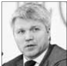
Павел КОЛОБКОВ Министр спорта РФ о задачах сборной России на Универсиаде-2019

«Мы полностью готовы к проведению игр Универсиады: 11 видов спорта будут представлены на играх, будет разыграно 76 комплектов наград <...> Во всех видах спорта мы (спортсмены сборной России) будем претендовать на завоевание медалей любого достоинства»