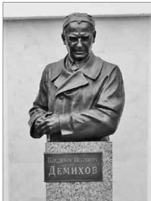
■ Бюст Владимира Демикова – одного из основоположников трансплантологии