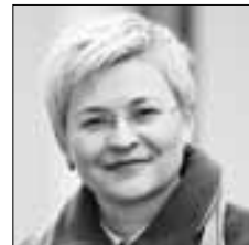
Людмила БОКОВА Первый замглавы Комитета Совета Федерации по конституционному законодательству и госстроительству об инициативе создания автономного Рунета

«Если сравнить развитие нашей внутренней розничной торговли с развитием ее в других странах, то у нас в два раза меньше торговых площадей на тысячу человек, чем во многих европейских странах. А малая нестационарная розница – важнейший формат торговли, он существует везде»