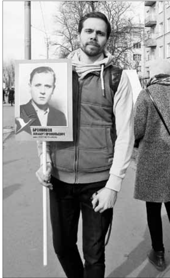
■ Валентин Малахов