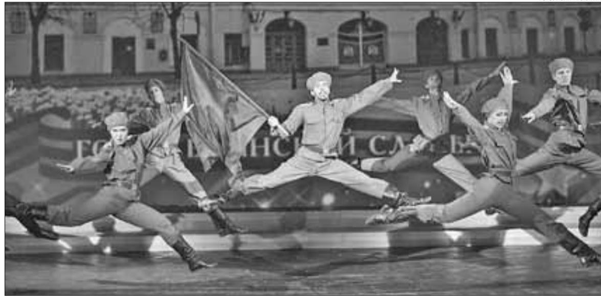
■ ФОТО: ИВАН МАЛЫГИН

участников из разных уголков нашей страны