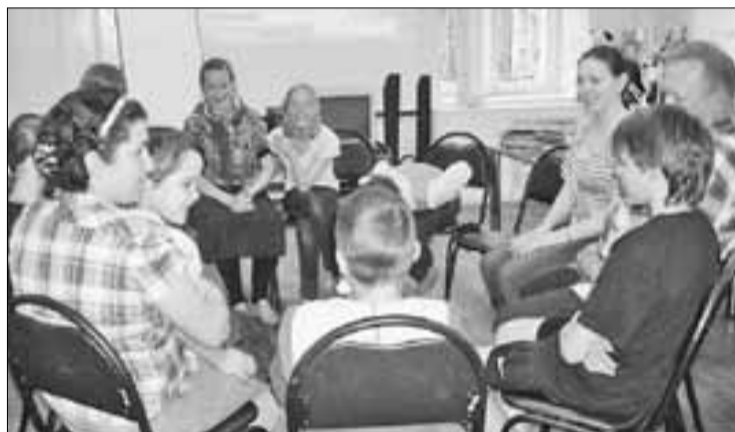
■ Общение детей и родителей очень важно.

Педагоги «Россияночки» рассказали об интересных формах проведения совместной образовательной работы с родителями воспитанников, познакомили с деятельностью родительского клуба, системой привлечения родителей к дням сотрудничества, созданию мини-музеев. Особый интерес педагогов вызвал опыт детского сада по знакомству с родным городом с помощью маршрутов выходного дня, активного сотрудничества с различными городскими учреждениями культуры и спорта.