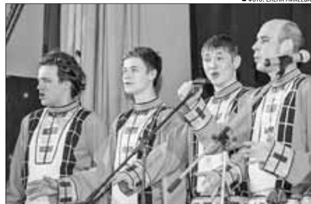
■ ФОТО: ЕЛЕНА МИХЕЕВА