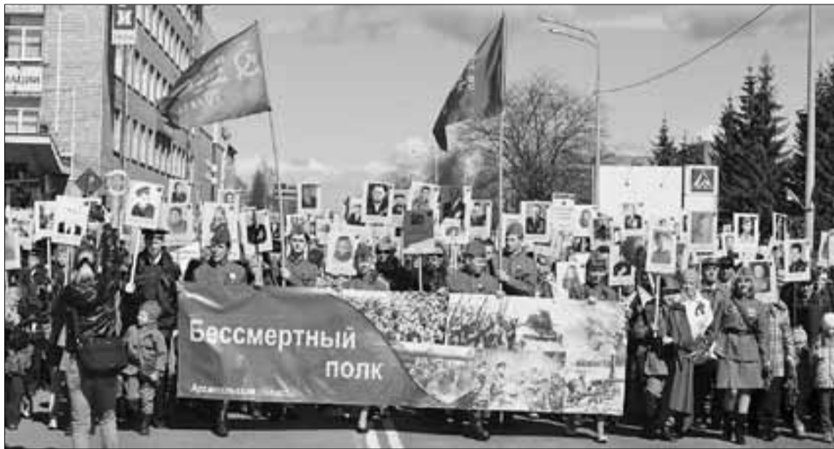
■ Патриотическая акция «Бессмертный полк» стала очень популярной

– Мы реализуем систему военно-патриотического воспитания