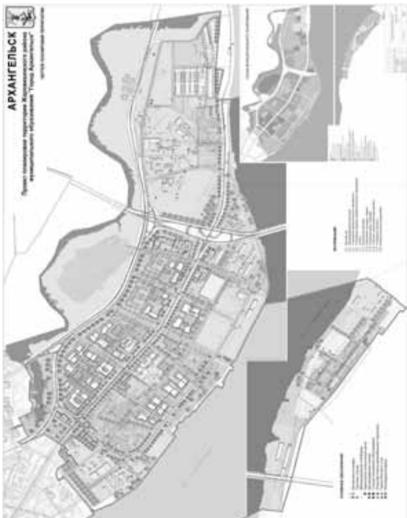
Приложение к проекту планировки