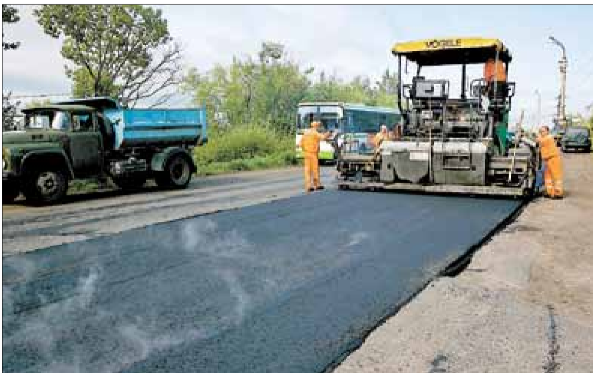
■ Ремонт на улице Мостовой делали летом 2014 года.

Между тем пока даже с текущим ремонтом ситуация складывается нерадуемая. Всего 97 миллионов