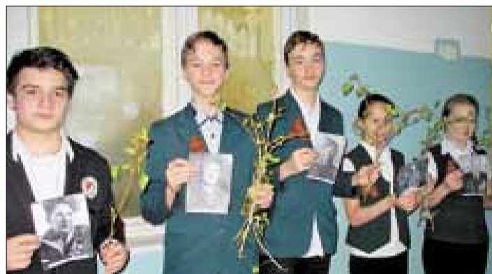
Ученики эколого-биологического лицея принесли фотографии своих родных – участников войны.

прадедов и станете достойными гражданами России.