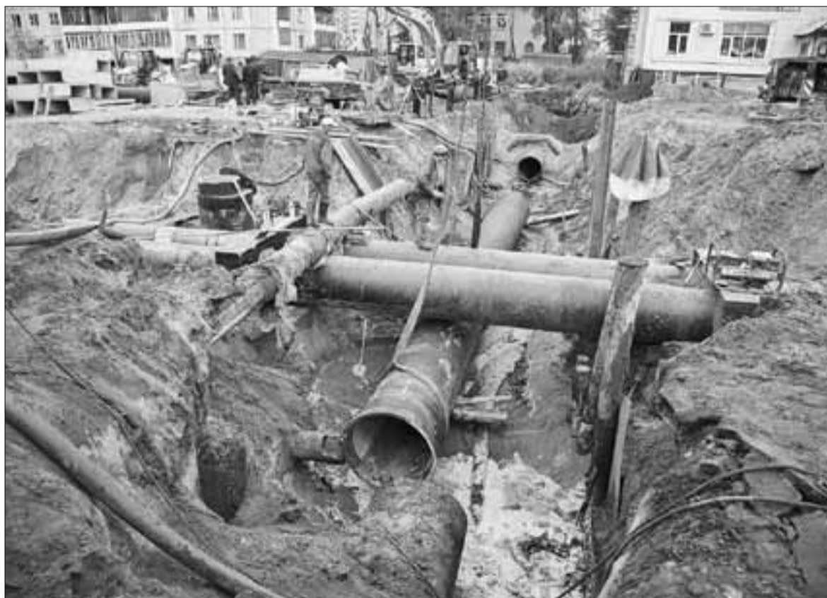
■ Водопроводное хозяйство города – сложный механизм, требующий пристального внимания и большого профессионализма работников «Водоканала».