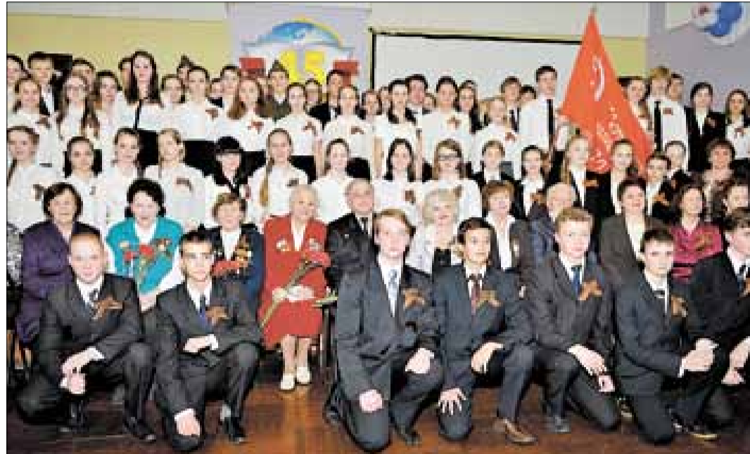
Участники акции «Знамя Победы» в 45-й школе.

Эстафета поколений: Молодые архангелогородцы помнят подвиг своих прадедов