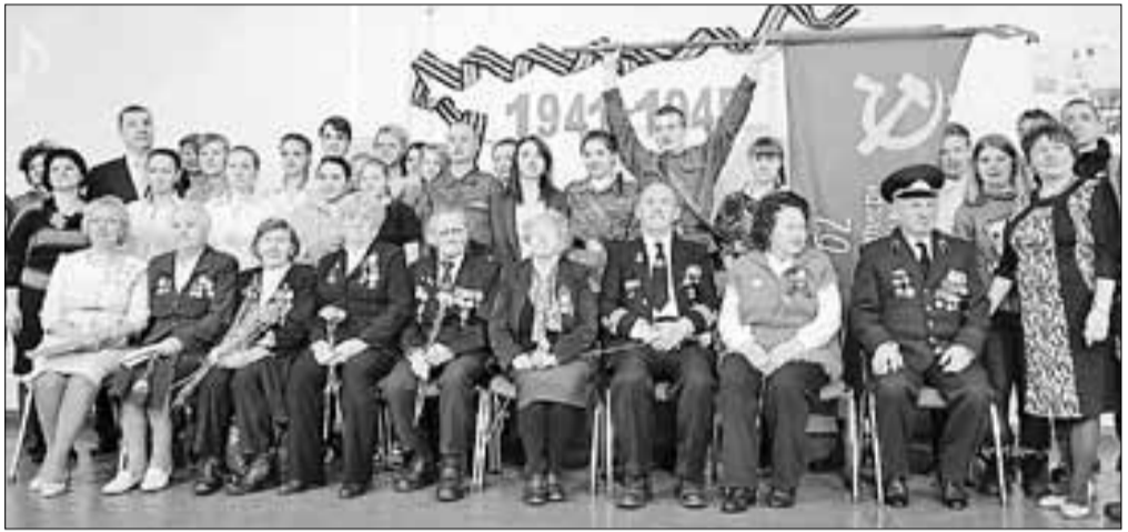
Участники акции «Знамя Победы» в Открытой общеобразовательной школе Архангельска