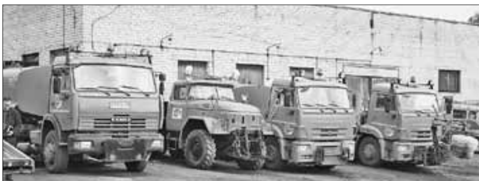
Техника «Архкомхоза» к двухмесячнику по уборке города готова.