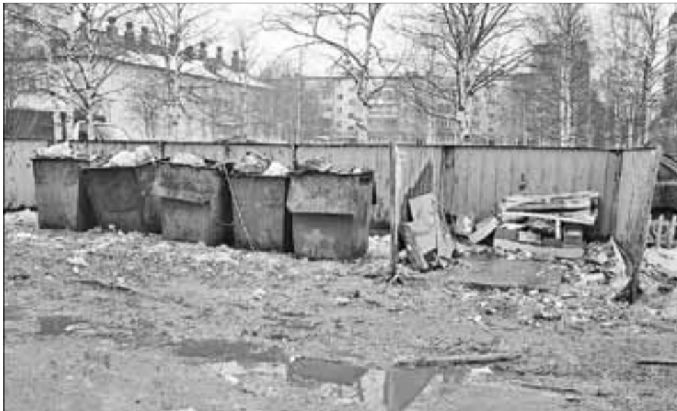
■ Контейнерная площадка, куда выносят мусор жители домов №3, № 3, корпус 1 и № 6 на проспекте Дзержинского (УК «Новый уютный дом» и «Уютный дом»).

Еще одна проблема – собираемость платежей не превышает 85 процентов. Дол-