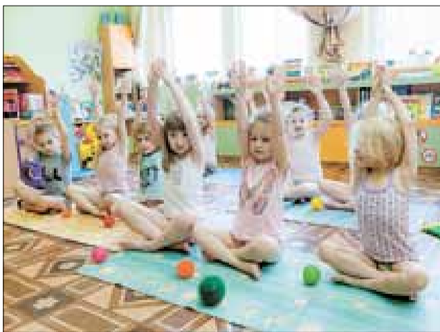
■ После дневного сна – бодрящая зарядка