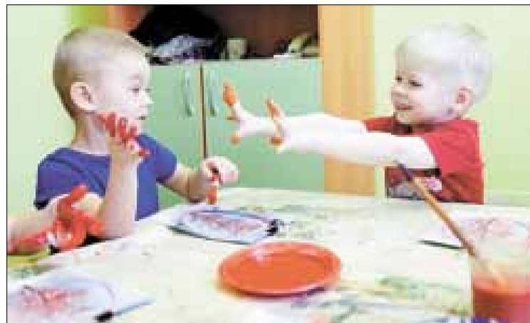
■ Необычные методики рисования позволяют проявить фантазию и развивают мелкую моторику