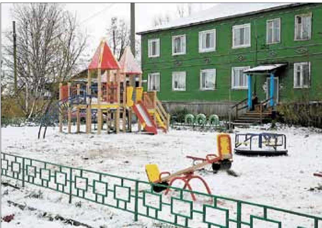
■ Детская площадка в поселке – заслуга ТОС «Кемский».