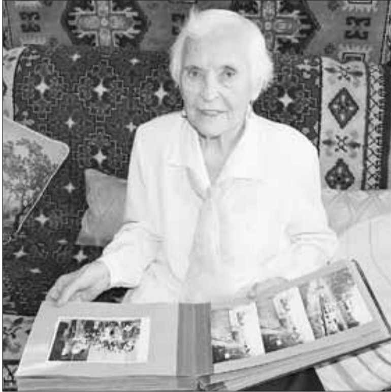
■ Старые фотографии влекут за собой воспоминания.

– В годы войны по комсомольской линии я курировала культмассовый сектор, с концертной бригадой мы ездил на фронт, в госпитали, – вспоминает ветеран. – Я танцевала матросский танец, в брючках, в бескозырочке. Морякам нравилось, что я девчонка, но могу и вприсядку, и с хлопучками. А как-то раз на фронте танцевали, борта двух грузовиков от-