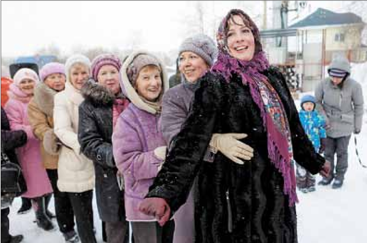
■ Песни и танцы согревали в морозный субботний день.

ТОС «Кемский» реализует в поселке социально значимые проекты