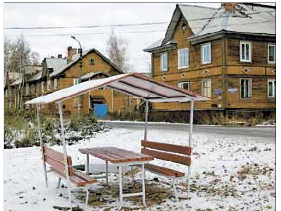
■ Набережная поселка Кемский стала излюбленным местом прогулок соломбальцев.