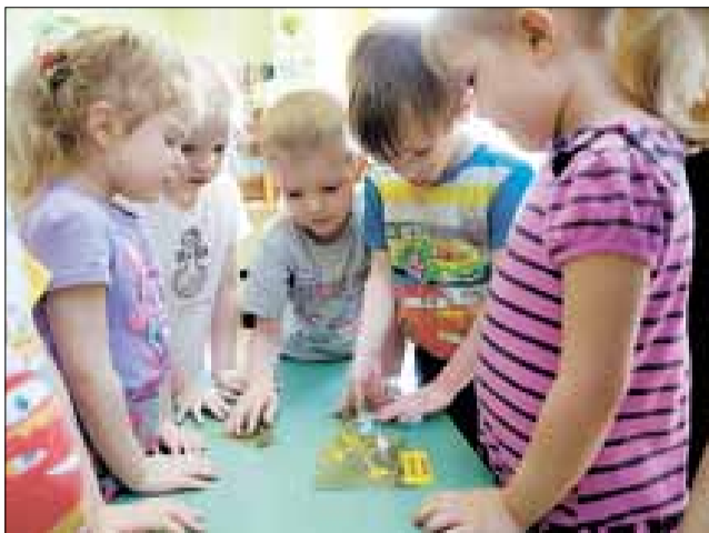
■ Уроки безопасности научат ребят быть осторожнее