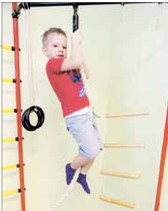
■ Дети обожают занятия в спортивном уголке