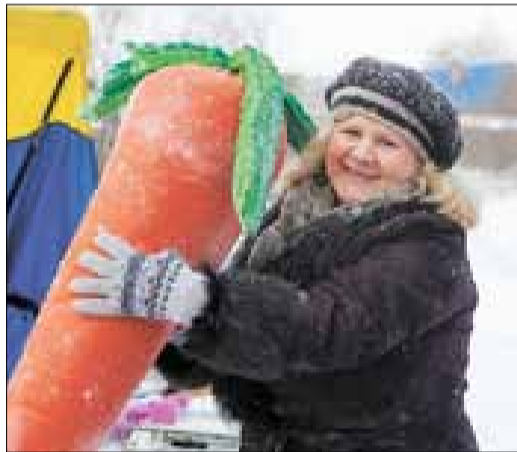
■ На весеннем празднике, устроенном активистами ТОС «Кемский», веселились и стар и млад.

День встречи весны выдался морозным, крупными хлопьями падал снег, но это не помешало жи-