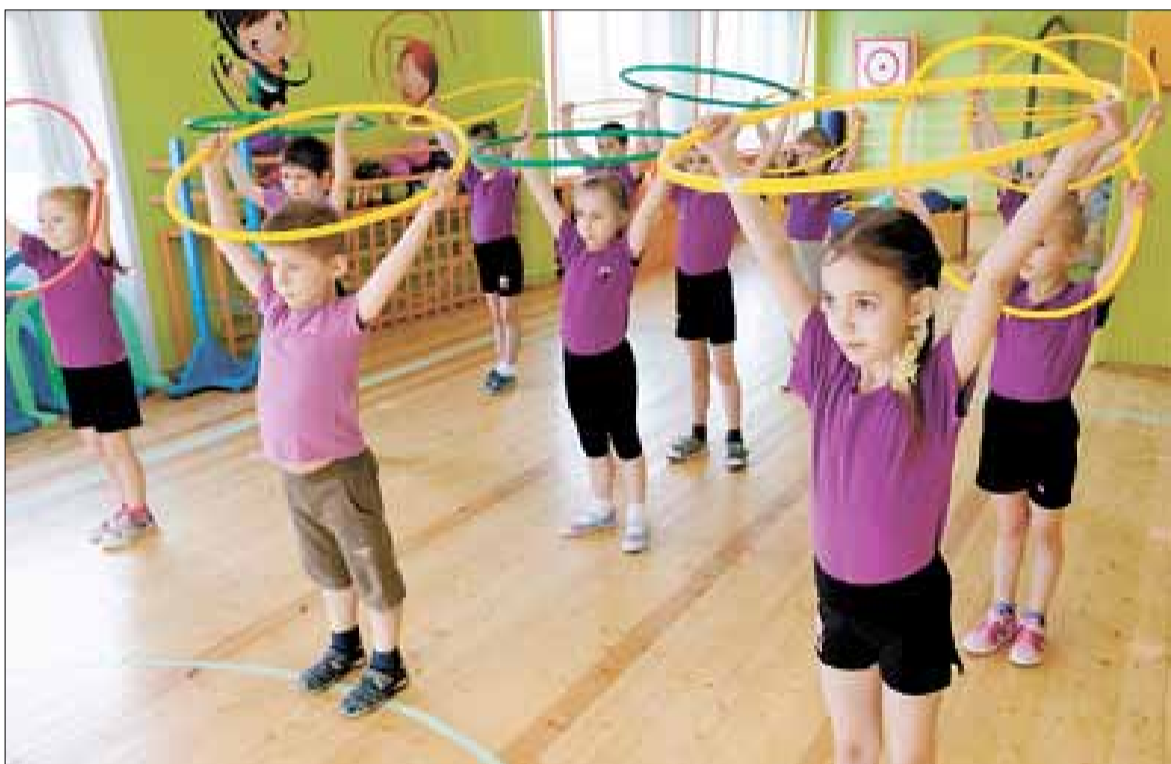
■ Группа «Фиалки» на физкультурном занятии

– Это и так называемая трудовая деятельность, например сбор природных материалов, самостоятельные занятия под контролем воспитателя. Проводятся подвижные игры, в которых более стар-