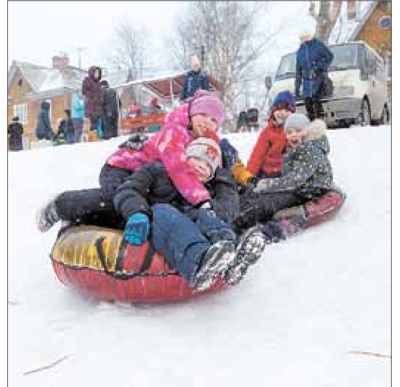
■ Зимние забавы в начале весны на Севере не редкость.