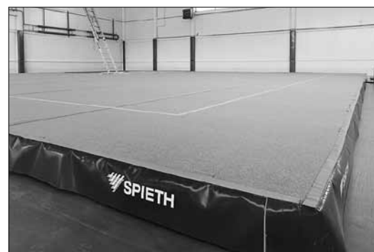
■ Помост для вольных упражнений напоминает огромный татами

тренировочному процессу. Это специальное сертифицированное оборудование для гимнастических залов.