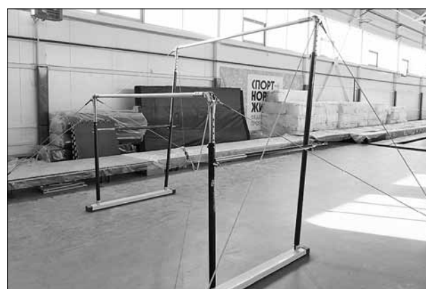
■ В зале уже смонтированы брусья и батутная дорожка