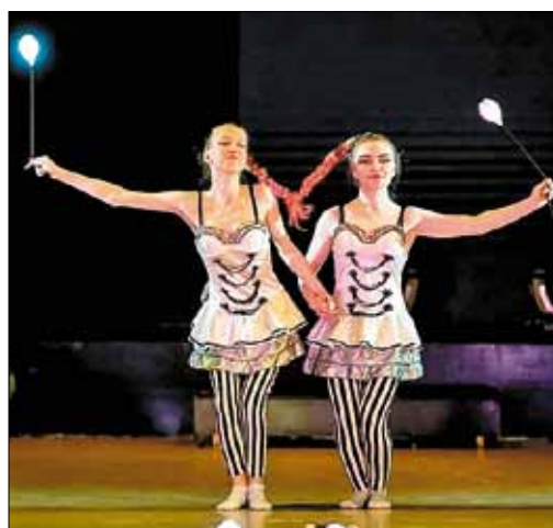
■ Театр света «Баттерфляй»