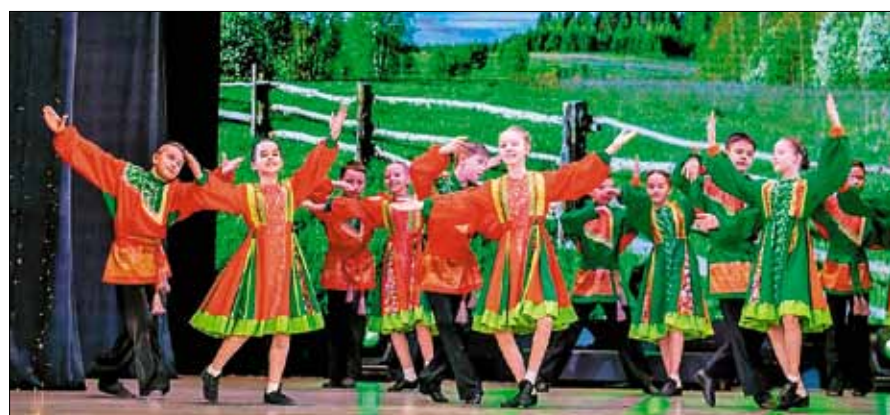
■ В детских творческих коллективах города занимается немало близнецов и двойняшек. На этот раз они представили зрителям красочные номера