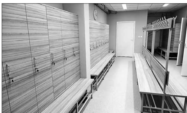
■ Ребята ждут удобные и просторные раздевалки