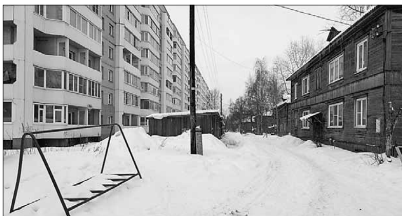
■ Жители «деревяшек» чувствуют себя обделенными, потому что и с УК им не везет, и ТСЖ им не создать