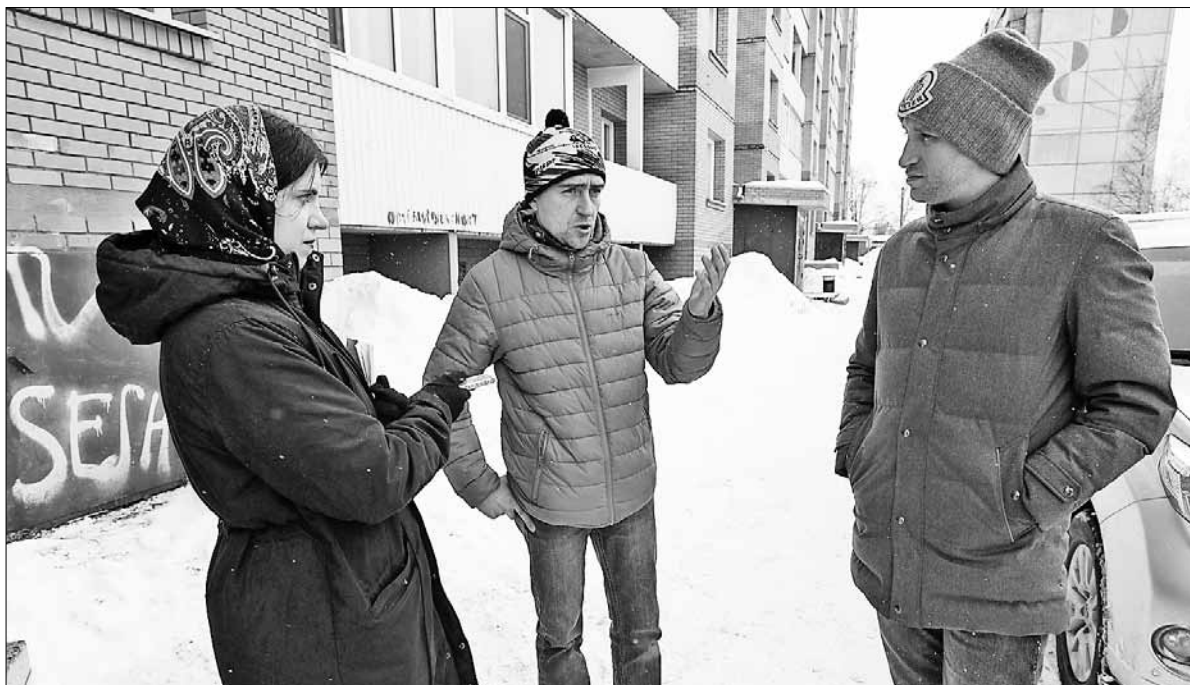
■ Жильцы дома по адресу: Павла Усова, 19, корп. 1 хотят преобразовать пространство под своими окнами

– Кроме того, менялись требования к детским площадкам. Нельзя просто взять и сколотить горку, все должно быть сертифицировано. Сертификация тоже стоит средств и затрагивает в итоге тех, кто потом эти площадки приобретает. Достаточно много площадок в городе установлены за внебюджетные деньги. К сожалению, они сейчас не могут пройти все требования безопасности, и их судьба может быть плачевной. Вплоть до