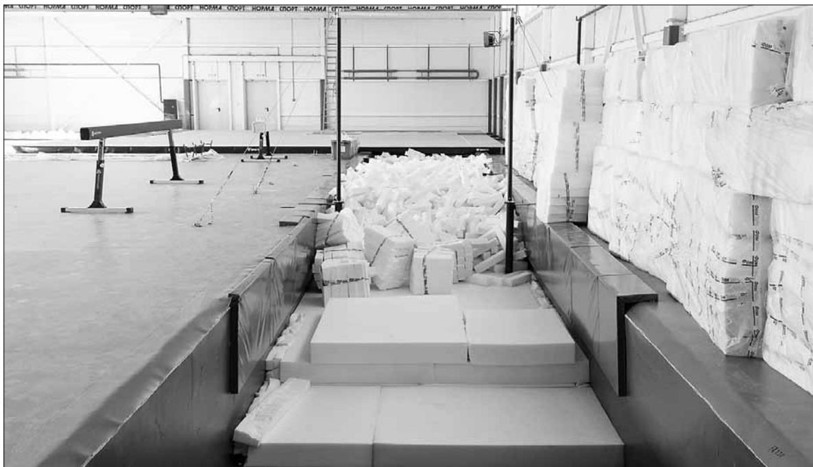
■ Яма, где будут устанавливаться «весовые» снаряды, заполняется специальными брикетами поролона

При проектировании этих ям мы обращались в Федерацию спортивной гимнастики России, там нам посоветовали подрядчика, чтобы грамотно составить техзадание. Все ямы сделаны строго в соответствии с требованиями, предъявляемыми к