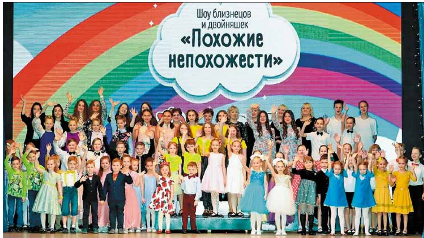
■ 35 пар участников были представлены на шоу