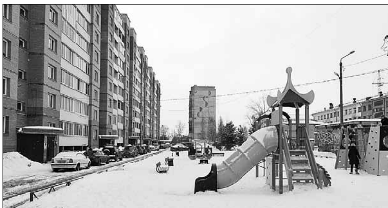
■ В рамках программы «Формирование комфортной городской среды» у многоэтажки привели в порядок детскую площадку