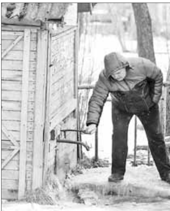
■ ФОТОРЕПОРТАЖ: ПРЕСС-СЛУЖБА АДМИНИСТРАЦИИ ГОРОДА