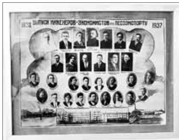
■ Выпускная фотография инженеров-экономистов по лесозэкспорту 1937 года