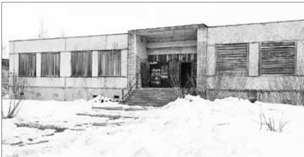
■ Пустующее нежилое здание можно переоборудовать с пользой для округа

Завершающим этапом поездки стала встреча в формате круглого стола, на которой был поднят ряд тем, касающихся создания комфортных условий для проживания жителей Исакогорского и Цигломенского округов, сообщает пресс-служба городской администрации.