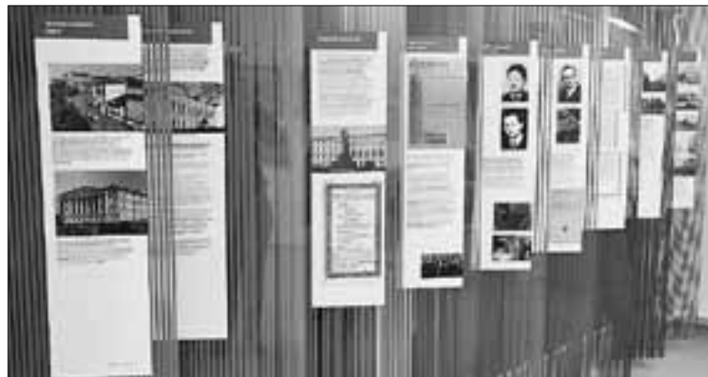
■ Университетская история Севера

В библиотеке 21 апреля с 18 часов и до полуночи будет работать почти 50 площадок, где можно погрузиться в атмосферу занимательной науки и инновационного творчества. Программа очень разноплановая: от мастер-классов по робототехнике и управлению шумовым оркестром до квестов и интерактивных игр.