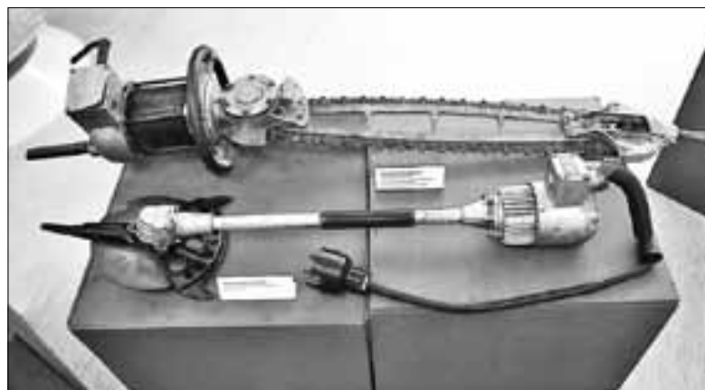
■ Один из поздних вариантов электропилы «АЛТИ» (вверху), созданной конструкторским бюро института