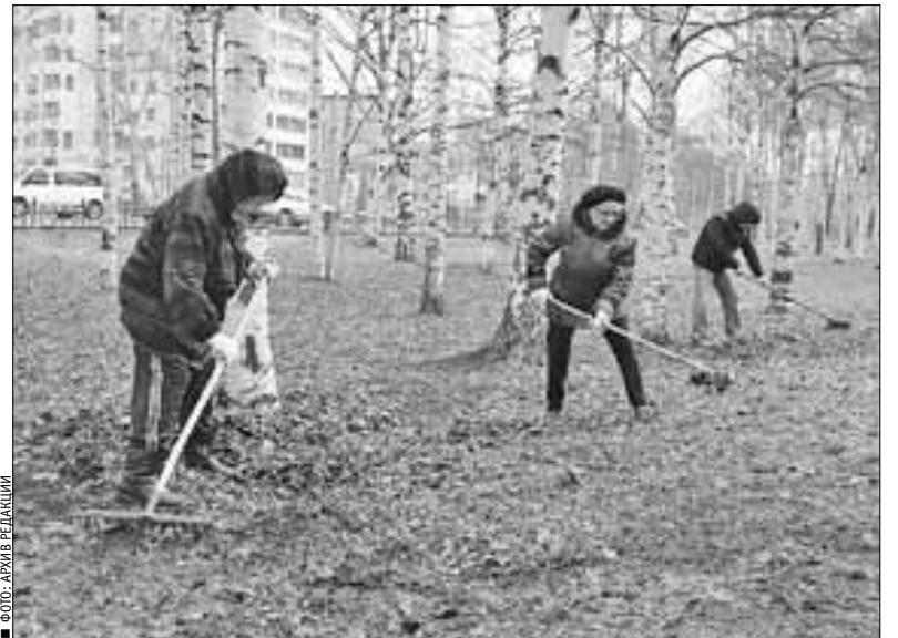
Объем выполненных работ должен быть подтвержден главой соответствующего округа. Информация

– На общественных территориях, вдоль дорог, во дворах, у всех объектов, принадлежащих ТГК-2, «РВК-Архангельск», электроснабжающим компаниям, должен быть наведен порядок. Речь идет о прилегающих к ним территориях. В городе после ремонтных работ разбросаны указатели, ограждения, поддоны. Все это должно быть убрано в ближайшие две недели. Необходимо максимально задействовать подрядные организации, которые занимаются уборкой дорог, санитарным содержанием территорий в округах. Такая же задача стоит перед всеми учреждениями, которым необходимо провести уборку у своих зданий и на прилегающих территориях. Работу начать нужно уже сегодня, – подчеркнул глава Архангельска Игорь Годзиш.