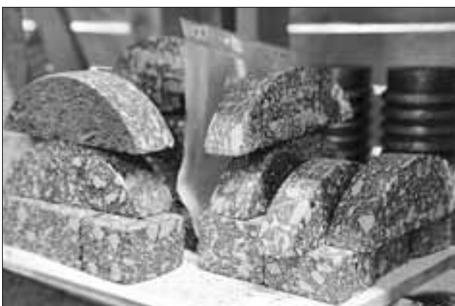
■ После укладки асфальта берутся образцы на контроль