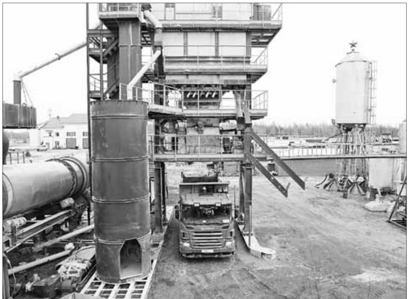
■ Современный завод может производить до 160 тонн асфальта в час

« Мы в своем асфальте уверены, потому что для этого у нас есть и современное оборудование, и собственная лаборатория, и грамотные кадры. Прошлый год показал, что мы производим качественный асфальт и хорошо ремонтируем дороги