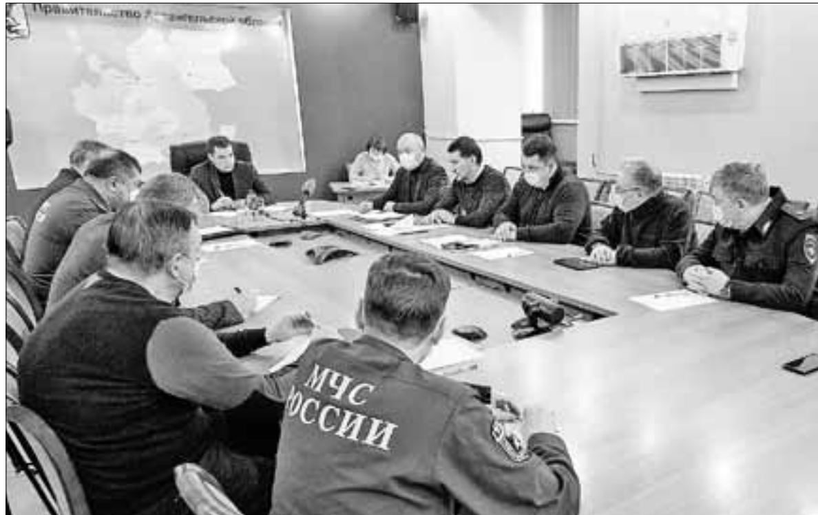
■ Заседание регионального оперативного штаба по противодействию новой коронавирусной инфекции.

В связи с создавшейся ситуацией врио губернатора Архангельской области Александр Цыбульский поручил проработать меры по усилению режима самоизоляции на территории региона. Он отметил, что это непростое и вынужденное решение, которое приходится принять исходя из негативного развития ситуации.