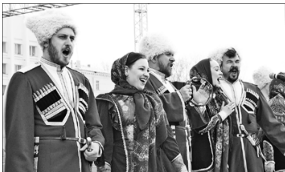
■ Для архангелогородцев споет Кубанский казачий хор

Кроме того, наш город вновь посетит прославленный коллектив России – Государственный академический Кубанский казачий хор. Его выступление станет продолжением проекта «От Белого моря до Черного», реализованного в 2013 году двумя выдающимися коллективами – Кубанским казачьим и Государственным академическим Северным рус-