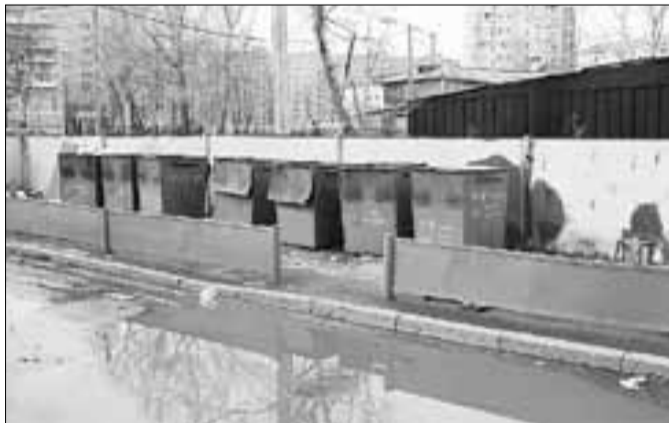
■ ул. Воскресенская, в районе гимназии № 3 (Октябрьский округ). Контейнеры УК «Профмастер», ТСЖ «Октябрьский округ», гимназии № 3

прямо из окон – тут, как говорится, комментарии излишни. Хотелось бы, конечно, через газету призвать таких людей к совести, но наверняка они газет не читают. Так что за ними приходится убирать другим – не жить же в грязи.