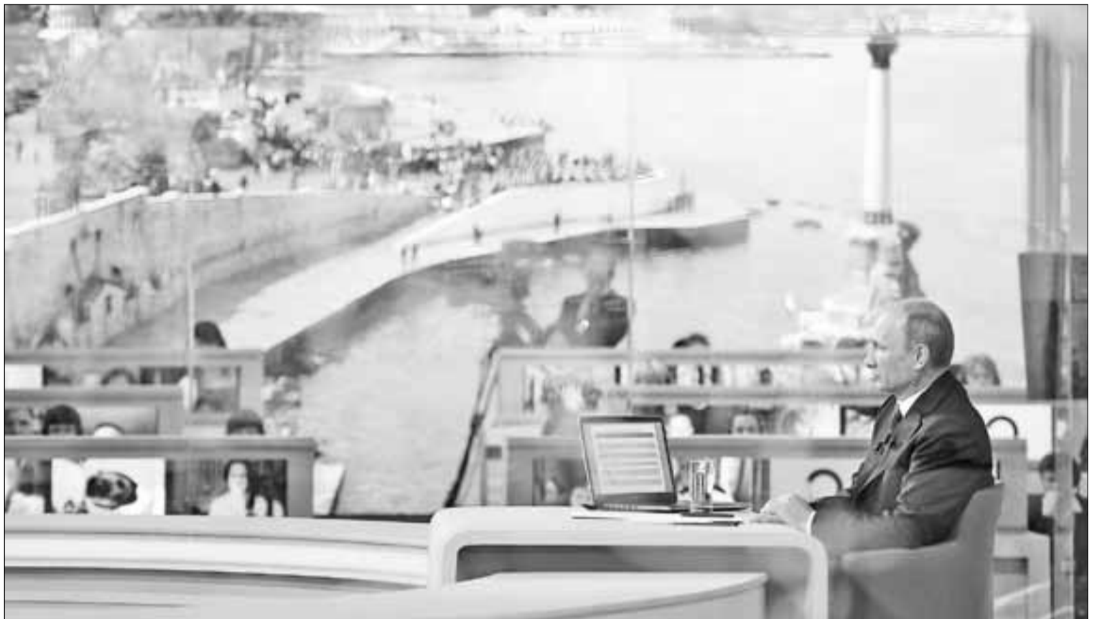
■ 17 апреля 2014. Президент России Владимир Путин во время разговора с Севастополем.

– Разумеется, это вопрос непростой, и все мы находимся под гнетом определенных эмо-