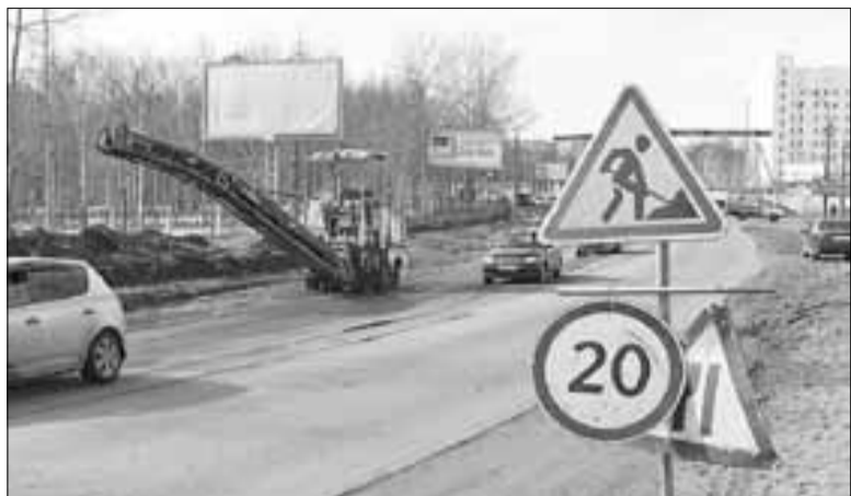
■ Дорожные работы на ул. Тесанова.