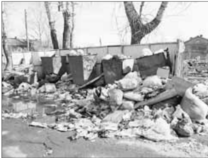
■ ул. Некрасова в районе домов 3 и 5 (Майская горка). ООО «Деком-3»