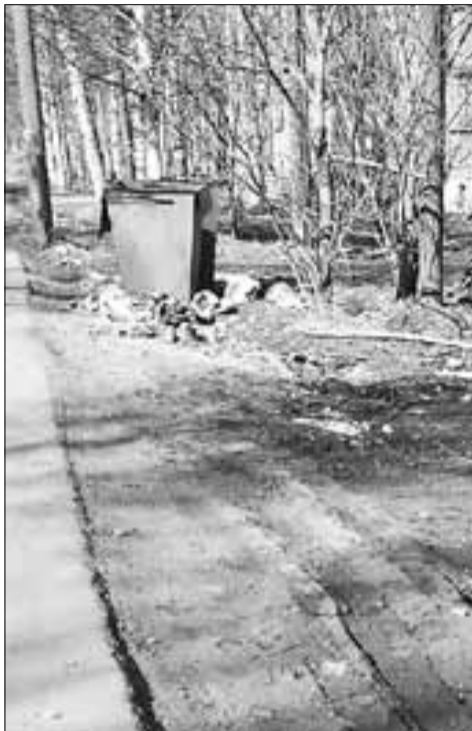
■ ул. Титова, 26, рядом с общежитием № 15 индустриально-педагогического колледжа (Северный округ)

Культура горожан оставляет желать лучшего. Пустую пачку из-под сигарет или сока на асфальт – запросто, окурки с балкона – пожалуйста, пакеты с мусором оставить прямо у подъезда – уже привычка, бросить мусор, не доходя до контейнера, – это мы тоже умеем. Думаю, что здесь родители в первую очередь должны сызмальства прививать своим детям культуру чистоты, чтобы они не бросали мусор где попало. Пока в Архангельске этого, к сожалению, нет. Но мусор-то к нам не с Луны же прилетает, мы его «производим» сами. Не редки случаи, когда мусорные пакеты и пустые бутылки выбрасывают