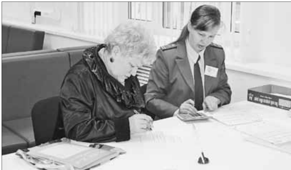
■ Сотрудники инспекции отвечали на вопросы посетителей по налогообложению, а также оказывали помощь в заполнении налоговых деклараций.

Как задекларировать доходы и получить вычеты