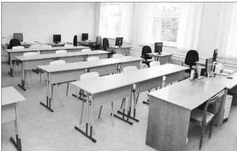
■ Во всех городских школах, независимо от их расположения, детям создают все условия для получения качественного образования

Люди, проживающие поблизости с престижными школами, размещают объявления о сдаче квартиры с возможностью временной регистрации целенаправленно для поступления в школу. Предлагают подобные услуги и риэл-