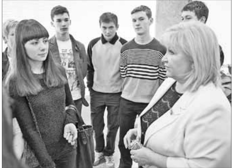
■ На следующий день на экскурсии в Госдуме побывали 11-классники школы № 43 из Северного округа Архангельска

на Андреевна уже на крыльце здания Палаты. – С московским движением в течение дня передвигаться по городу очень сложно, и время, которое предстоит провести в дороге, предсказать порой невозможно. Нам сегодня повезло, что все места, где мы побывали, расположены рядом друг с другом. Но чаще всего я планирую не больше одной-двух встреч в день.