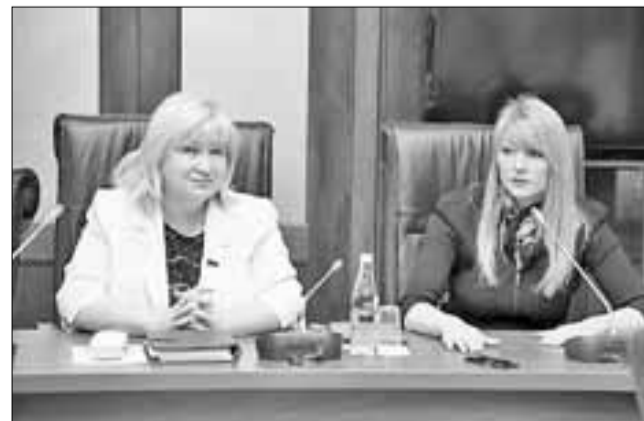
■ Во встрече с архангельскими школьниками принимала участие депутат Госдумы Светлана Журова