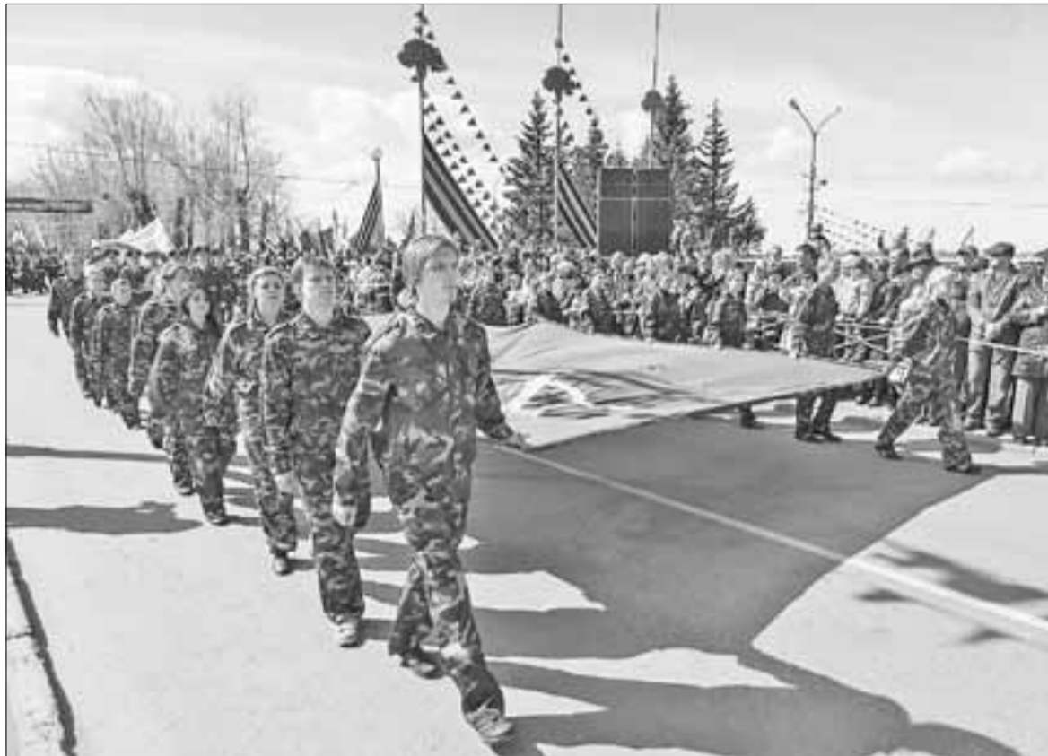
■ День Победы в Архангельске традиционно собирает представителей всех поколений.

– Интересным событием для меня стало участие в «Тотальном диктанте», который впервые прошел в Архангельске. Хотя я не любительница участвовать в массовых мероприятиях, пошла на него со своей дочерью. К диктанту не готовилась, мне было интересно узнать свой уровень на текущий момент. Диктант представил для меня некоторую сложность, и ошибки были в основном пунктуационные. Что меня, в принципе, не очень расстроило, потому что я знаю, над чем надо работать. Если говорить о языке как о культурном наследии, то, конечно, надо сохранять его и начинать в первую очередь с себя.