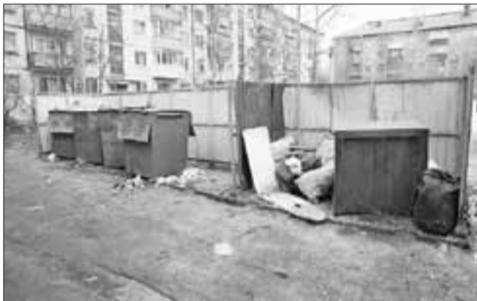
■ пр. Ломоносова, 278 (Октябрьский округ). ООО «Городское жилищное управление»