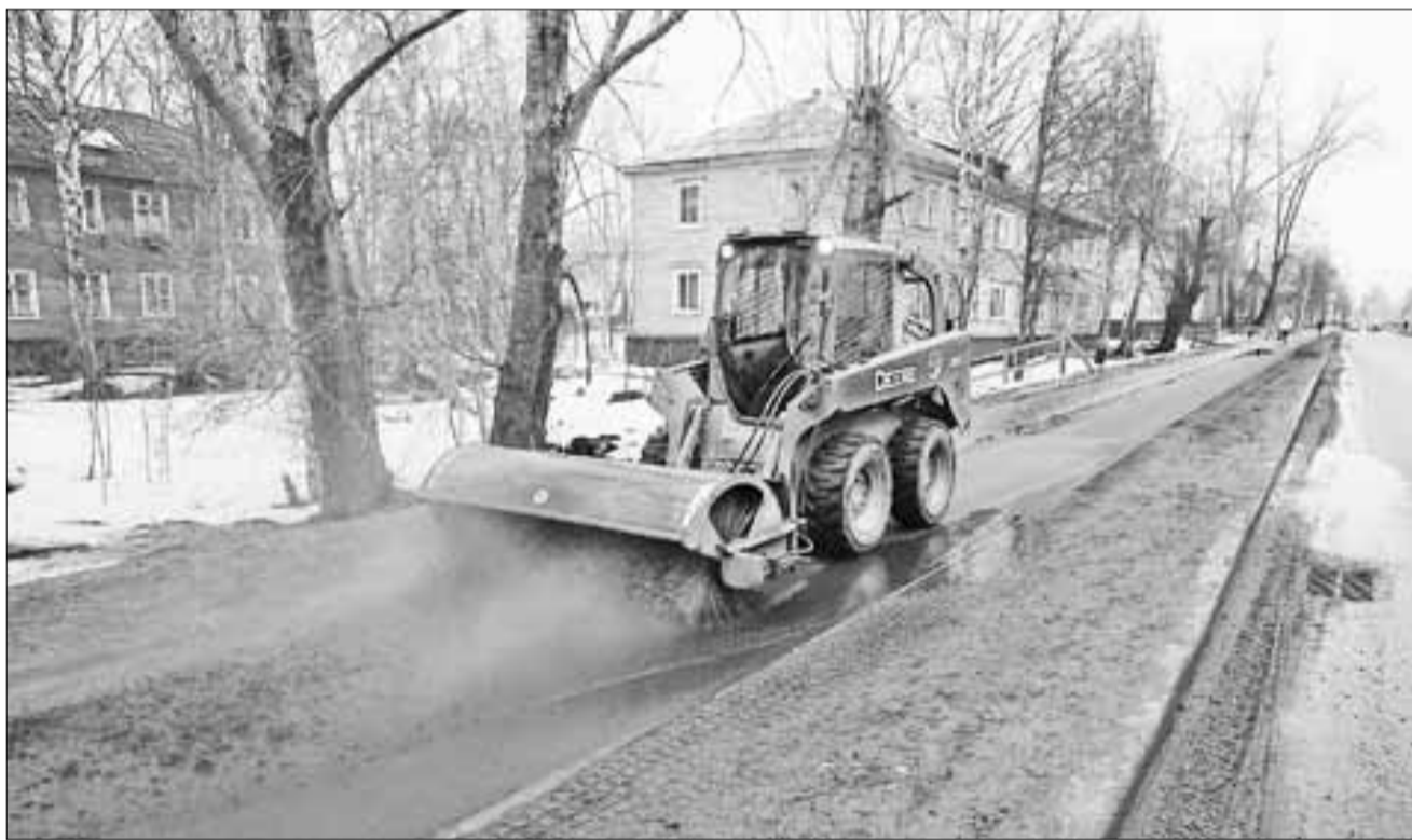
■ «Джон Дир» потребляет меньше топлива, чем крупногабаритная техника, а мощность его в разы выше.

В МУП «Архкомхоз» появилась новая техника для уборки тротуаров