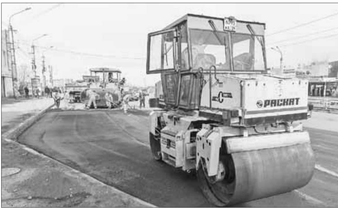
■ Асфальтирование участка на ул. Гагарина от Кузнечевского моста до Троицкого проспекта.

Этот же подрядчик приступил к ремонту ул. Тесанова. Здесь выполняется фрезерование дорожного покрытия. Начинаются работы на улицах Мостовая и Кировская. В конце апреля дорожники выйдут на ремонт пр. Бадигина (от ул. Розинга до по-