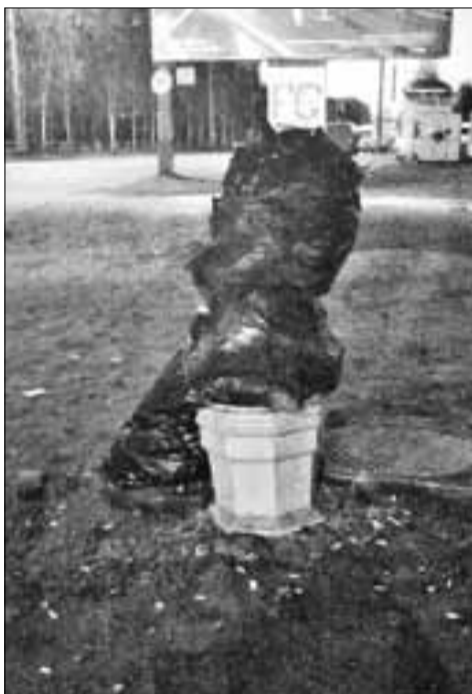
■ Перекресток Маяковского и Советской (Соломбальский округ)