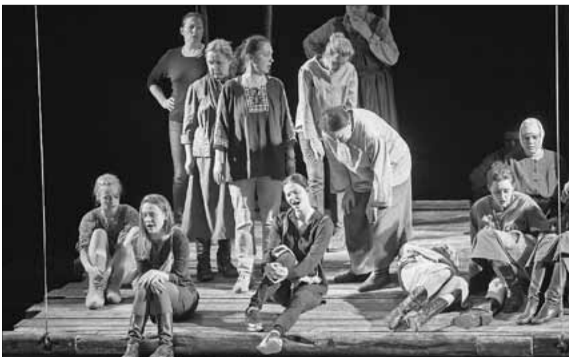
■ Репетиция спектакля: эмоции на сцене такие же яркие, как и на премьере

Гастроли актеров Малого драматического театра в Поморье состоялись при поддержке правительства региона и благодаря большому желанию губернатора Игоря