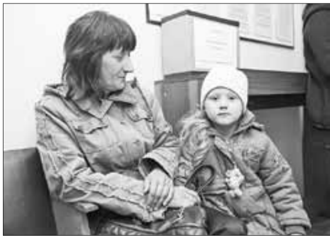
■ В «одном окне» можно решить различные вопросы по детским садам