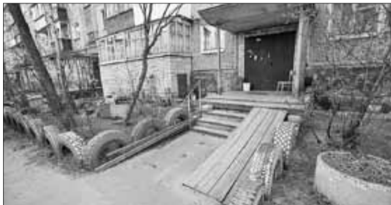
■ На Красных Партизан, 16 двор чисто убран.

– По распоряжению главы города о проведении «санитарных» пятниц во дворах идет уборка территории. Дворники также постоянно в работе. Неравнодушные жильцы, председатели и члены советов домов приняли участие в уборке во всех дворах, находящихся под нашим управлением. Теперь порядок будем под-