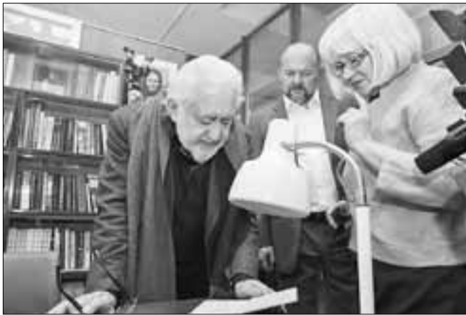
■ Режиссер Лев Додин в Абрамовском кабинете Добролюбовки