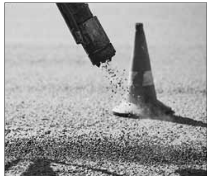
■ Щебень вперемешку с эмульсией заливается в яму