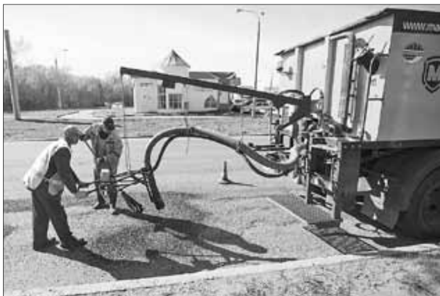
■ Технология ремонта не требует особой подготовки дорожного полотна

Загрузив в машину необходимые материалы, бригада приступает к работам. Внутри установки – разогретая битумная эмульсия и мягкий мелкий щебень. Из выбоины сначала выдувается мусор, затем она заливается эмульсией, щебень вперемешку с эмульсией за-