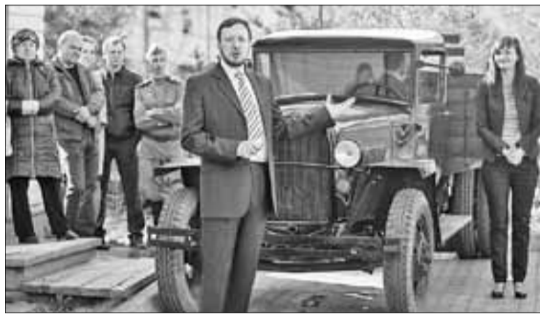
■ Полуторка своим ходом добралась до музея

На выставке представлено медоборудование военного времени, например лампа для работы в условиях светомаскировки из коллекции СГМУ.