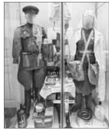
■ Форма, пошитая в США

Авторы выставки попытались воссоздать интерьеры крестьянского дома и городской квартиры, чтобы показать жизнь и быт прифронтового села и города в условиях постоянных бомбардировок. Кроме того, на выставке в усадьбе Куницыной можно увидеть промышленные товары, поставившиеся в Архангельск по договору о ленд-лизе, личные вещи и доку-