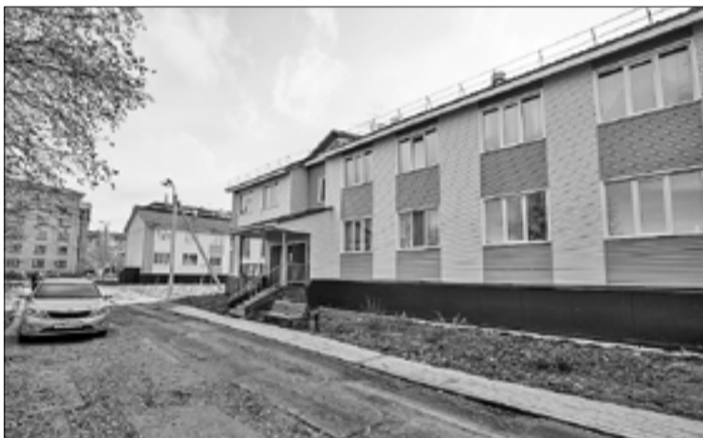
■ Улица Конзихинская превратится в целый микрорайон.

Благодаря инвестору удалось не только быстро и качественно построить современное здание детсада, но и положить начало новому вектору в решении проблемы с местами в дошкольных учреждениях.