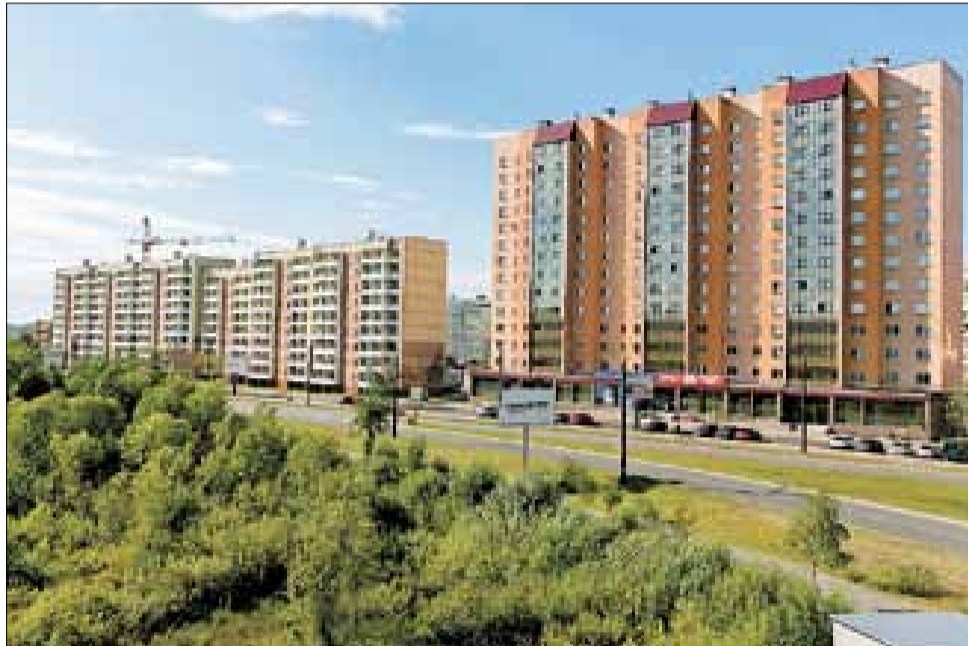
■ Новые дома на Московском проспекте.