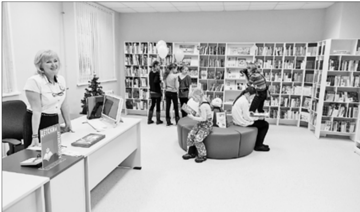
■ Новая библиотека в Маймаксе.

На середину июля намечена проверка системы наружного освещения, а в первой декаде августа на улицах областного центра вновь зажгутся фонари.