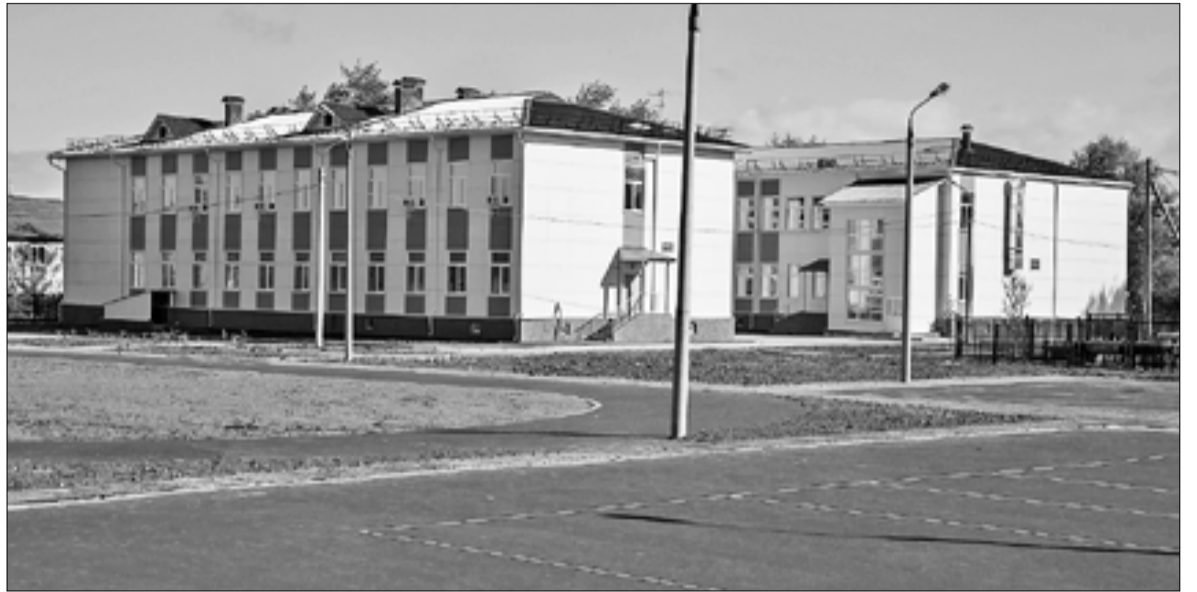
■ Новая школа в Цигломени стала центром жизни поселка.

Продукция нового предприятия будет поддерживать прежде всего местных производителей тепла.