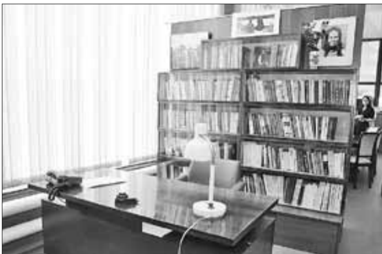
■ Коллекция книг Федора Абрамова оформлена в виде кабинета писателя, где есть предметы быта, которыми он пользовался