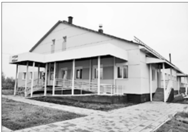
■ Открытие городскими властями новой бани на улице Тарасова стало настоящим событием для жителей поселка второго лесозавода.

Самый трудный вопрос округа – дорожный. Его архангельский муниципалитет решает по мере сил и средств, отдавая приоритет жизненно важным магистралям. Среди них – Ленинградский проспект. Последний раз он ремонтировался в середине 2000-х. Наиболее проблемный участок – от развилки с Окружным шоссе в сторону поселка Силикатчиков. Поэтому именно отсюда в прошлом году началось восстановление стра-