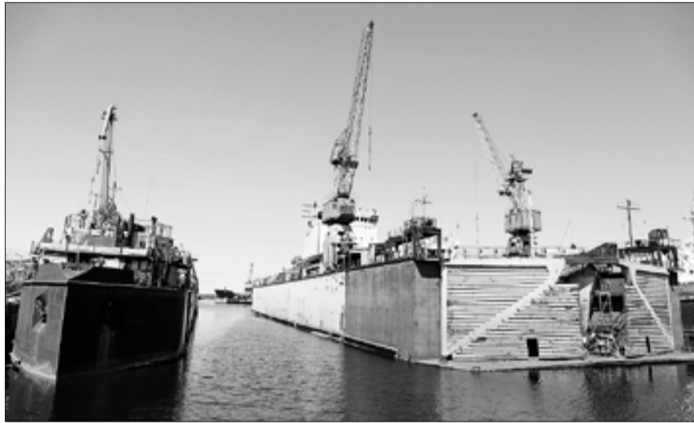
■ На соломбальской судовой снова кипит жизнь.

Возрождение производства, несомненно, положительно скажется на жизни жителей округа