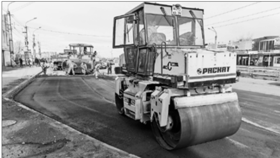
■ Летом 2014 года ремонтировали одну из важнейших транспортных артерий округа – улицу Гагарина.

В Октябрьском округе развивается движение ТОСов. Например, ТОСу на улице