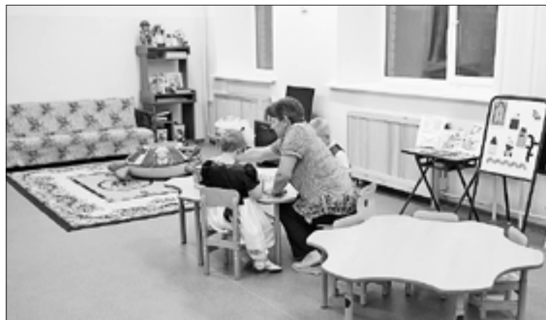
■ В Центре охраны прав детства.

А это значит, что дорога по маршруту автобуса № 3 на Исакогорском участке совсем скоро будет отремонтирована. Останется решить проблему с самым автобусным сообщением. Поездка в центр города и обратно для тех, кто живет на Левом берегу, сопряжена с немалыми трудностями.