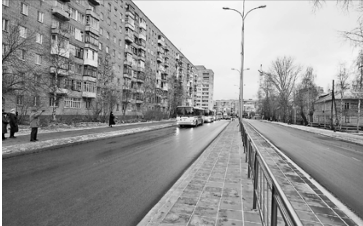
■ Новая дорога связала разные районы города.

– Нами были подписаны охранные обязательства по восстановлению памятника. Для нас было интересно и важно соединить нить