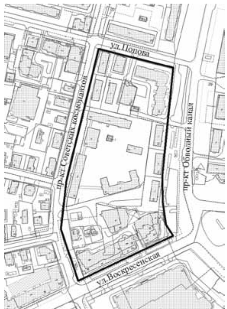
СХЕМА границ проектирования

Приложение к техническому заданию на подготовку проекта планировки территории муниципального образования "Город Архангельск" в границах просп. Советских космонавтов, ул. Попова, просп. Обводный канал и ул. Воскресенской площадью 4,5125 га