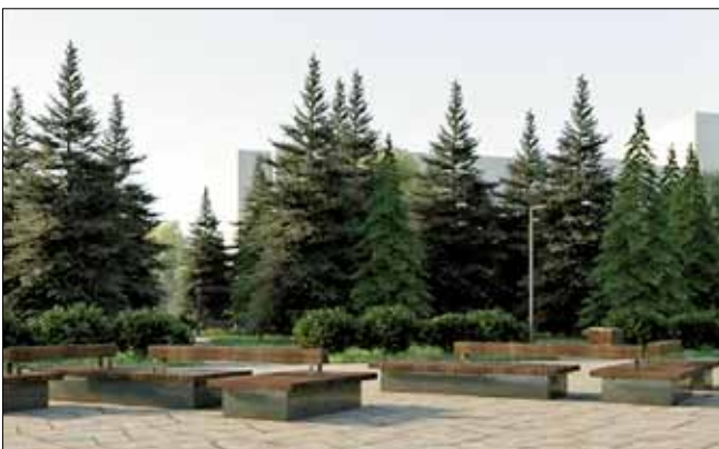
■ Общественная территория перед Дворцом спорта профсоюзов