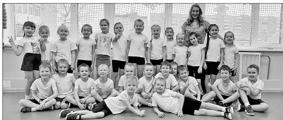
■ Детский сад № 121 «Золушка»