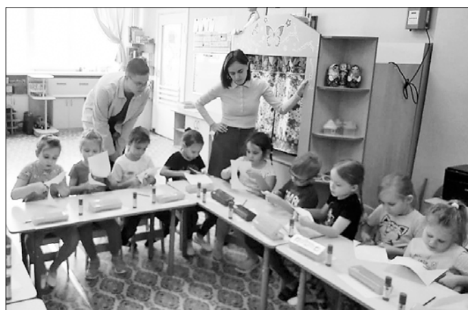
■ В трех дошкольных учреждениях Октябрьского округа (№ 121 «Золушка», № 131 «Радуга», № 147 «Рябинушка») при поддержке и ходатайстве парламентария заменили оконные блоки (на фото – детский сад № 131 «Радуга»)