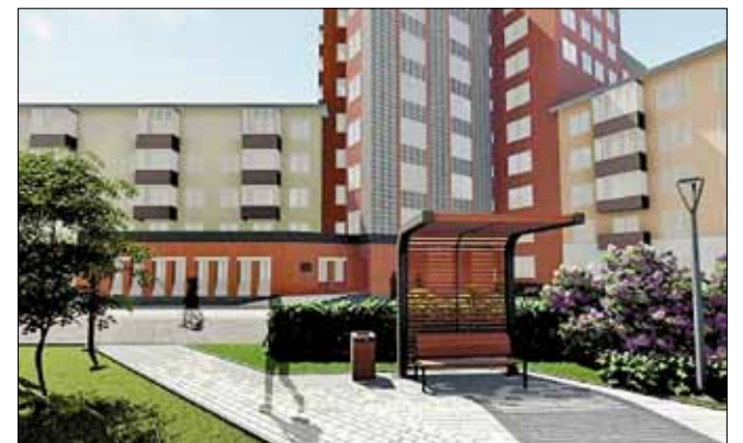
■ Сквер в районе ул. Воскресенской и пр. Обводный канал, 48, 50