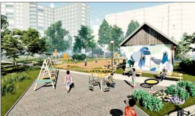
■ Общественная территория между домами № 80 на ул. Логинова и № 89, № 91 на ул. Воскресенской