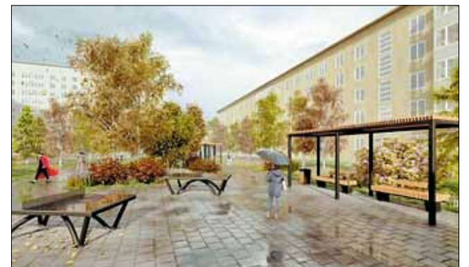
■ Общественная территория за домами № 108, № 110 на ул. Воскресенской