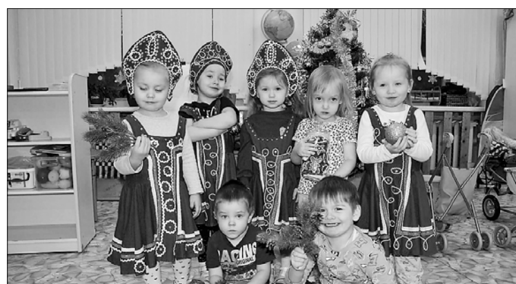
■ Для детского сада № 96 «Сосенка» была приобретена кухонная машина