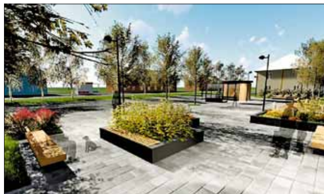
■ Сквер на пересечении ул. Гагарина и пр. Советских Космонавтов по четной стороне