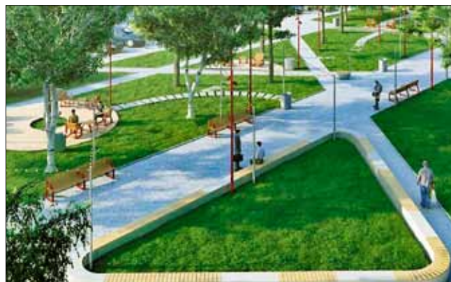
■ Сквер на пересечении пр. Троицкого и ул. Поморской