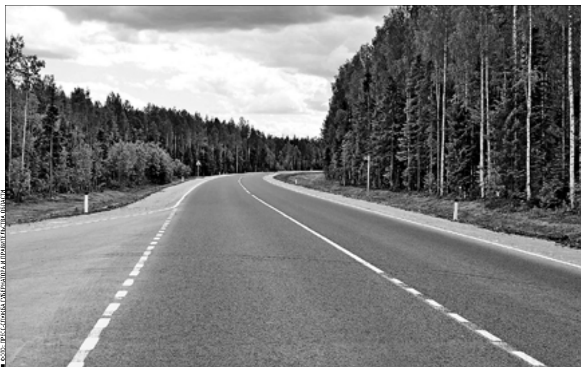
ФОТО: ПЛЕСЕЦК, СЪЕМКА С БЕРЕГА РЕКИ И ПРАВИТЕЛЯ ОБЛАСТИ

Работы на трассе Брин-Наволоки – Плесецк – Каргополь были начаты по поручению президента Владимира Путина от 24 мая 2013 года в рамках подпрограммы «Развитие