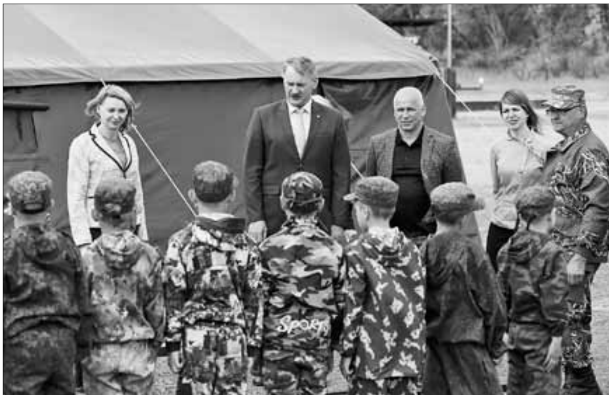
■ ФОТОРЕПОРТАЖ: ИВАН МАЛЫГИН