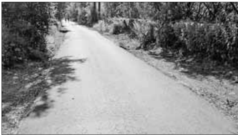
■ Отремонтированная дорога в Цигломени