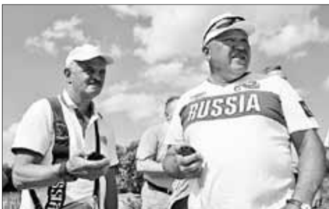
■ На участке реки напротив Исакогорского ДЮЦ проводилось первенство Северо-Западного федерального округа по гребле на байдарках и каноэ

Создаются в Исакогорке и условия для занятий творчеством. Детская школа искусств № 48, расположенная на улице Нахимова, пользуется популярностью у местных