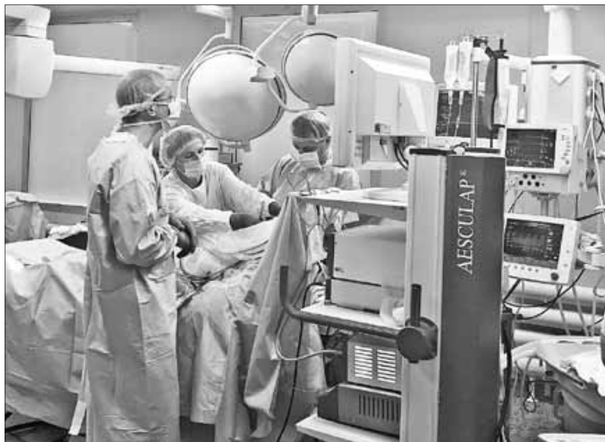
■ Хирурги не делают разрезы, а оперируют через небольшие проколы