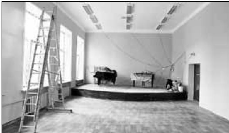
■ В ДШИ № 48 идет ремонт актового зала

обновлено асфальтовое покрытие проезда от ул. Цигломенской вдоль домов №№ 66, 68 по ул. Пустошного до здания школы № 73 по ул. Стивидорской, 11, а также проезда от ул. Пустошного вдоль домов №№ 25, 17, 15, 13 по ул. Красина. Занимался этим подрядчик ООО «Дорожный сервис».