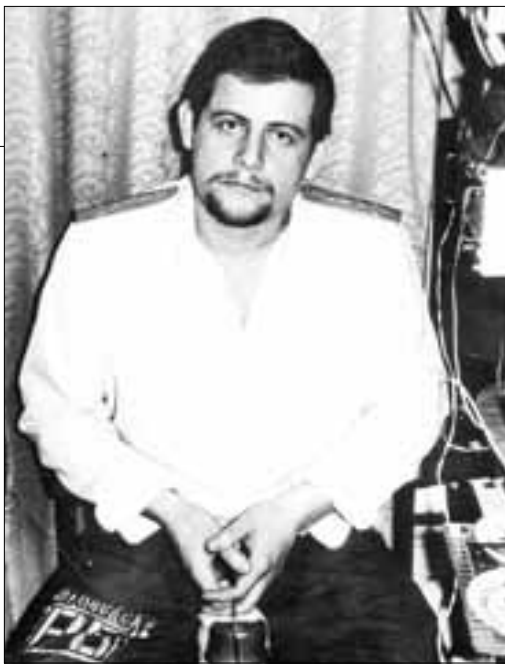
■ На подводной лодке на глубине 150 метров. Средиземное море. 1988 год