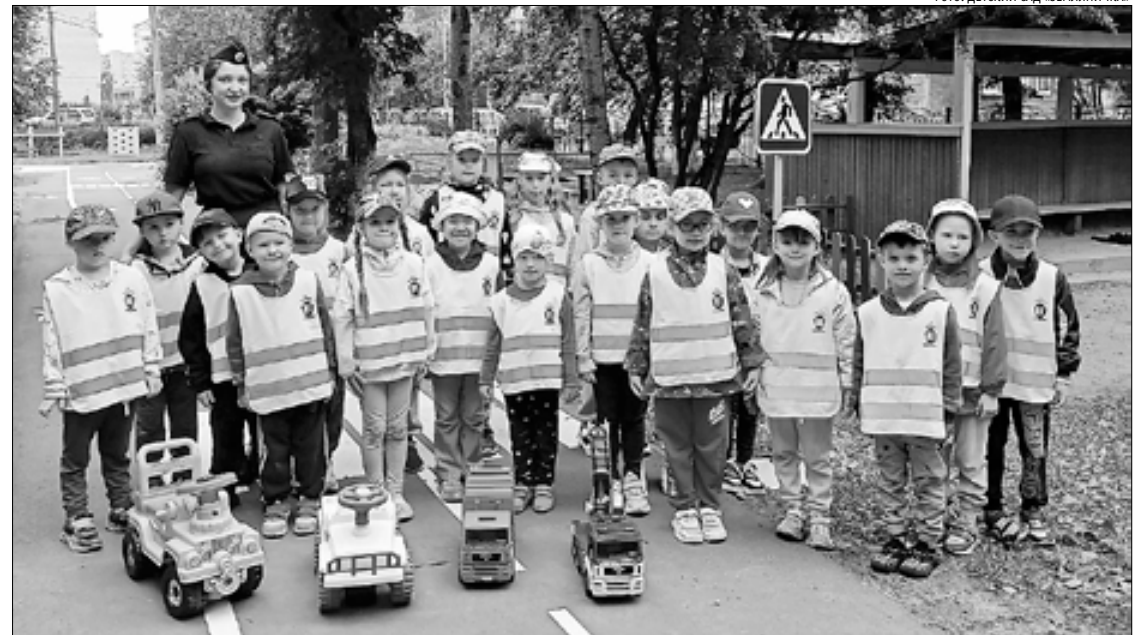
ФОТО: ДЕТСКИЙ САД «ЗЕМЛЯНИЧКА»

«Правила движения для всех без исключения!» – под таким девизом 16 июля в дошкольном учреждении прошло тематическое занятие, в котором приняли участие дети старшей и подготовительной групп.