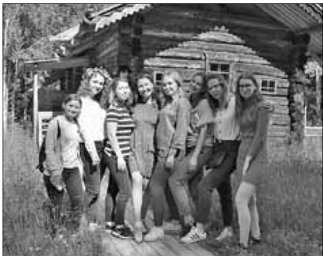
■ В Малых Корелах.

приезжают летом в Архангельск и работают здесь в медучреждениях