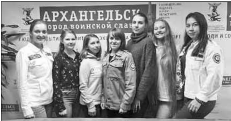
■ «Коллеги» в гостях в редакции нашей газеты.