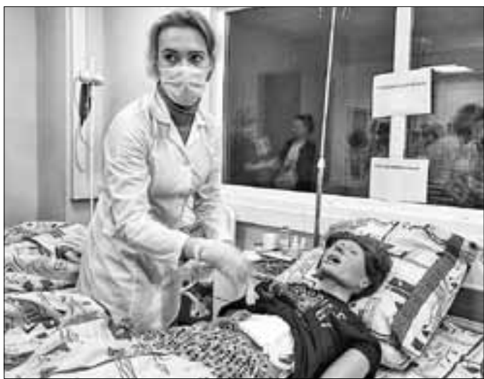
■ На конкурсе профессионального мастерства.