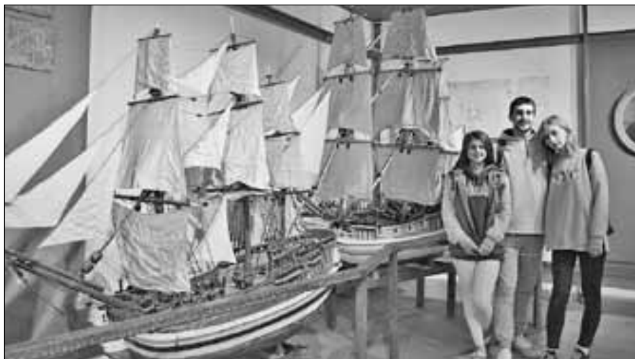
■ Нашлось время и для посещения музеев.