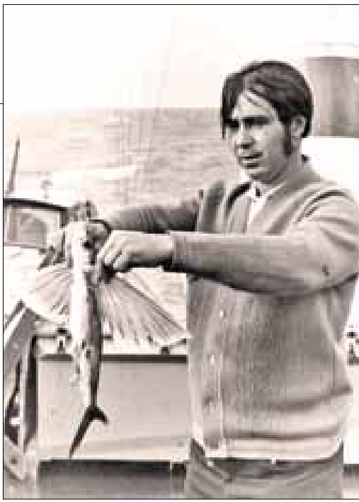
■ Летучая рыба. Атлантический океан.