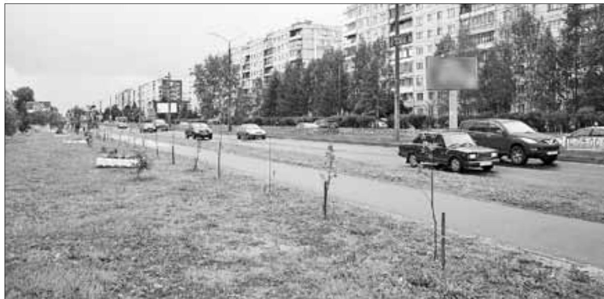
■ Улица Прокопия Галушина

В следующих номерах мы продолжим рассказ об улицах, чьи названия связаны с Победой.