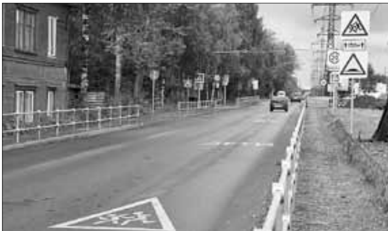
■ Улица Павла Усова

До войны окончил семилетнюю среднюю школу № 2 в Архангельске, после чего стал учеником машиниста, а затем машинистом парохода «Сура» Северного морского пароходства.