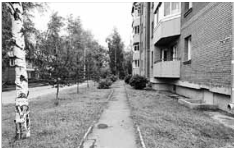
■ Проезд Бадигина

На карте Архангельска есть немало точек, связанных с героями роковых сороковых