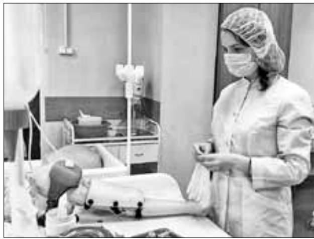
■ Трудовой семестр – это учеба и практика.