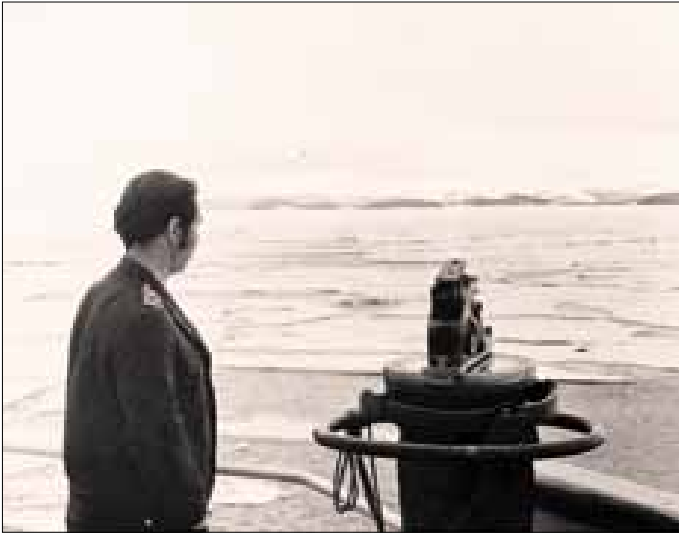
■ Земля Франца-Иосифа с ледокола Пахтусов.