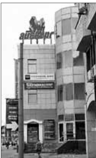
■ Бизнес-центр «Айсберг»