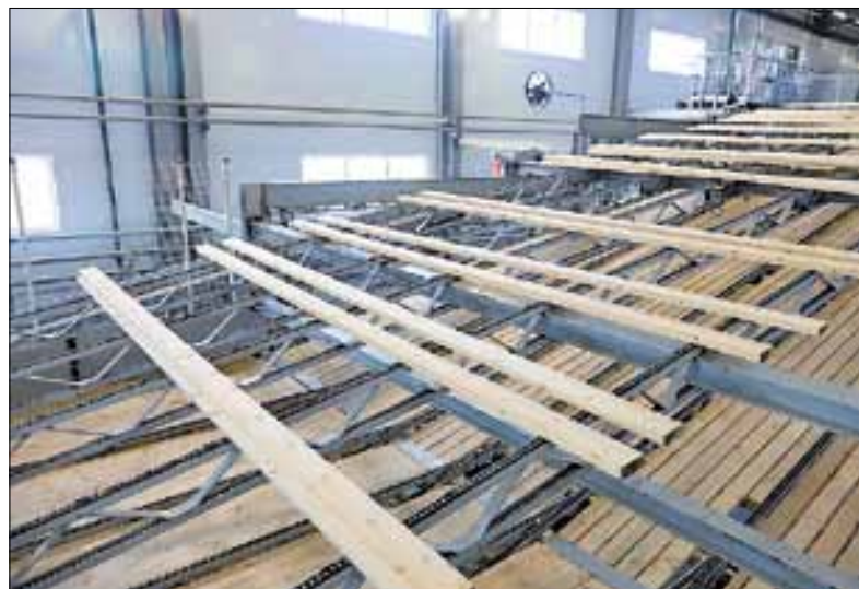
■ Выпускаемая продукция соответствует единому стандарту качества ЗАО «Лесозавод 25»