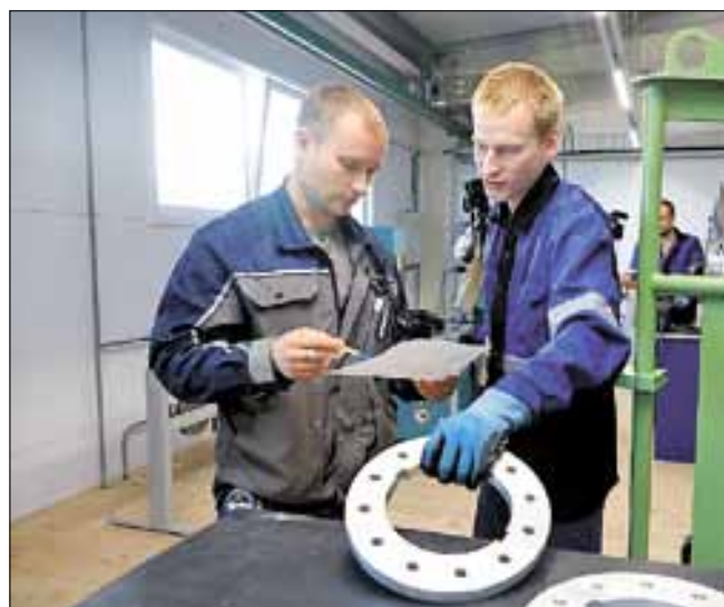
■ Число рабочих мест на трех производственных участках предприятия достигнет полутора тысяч