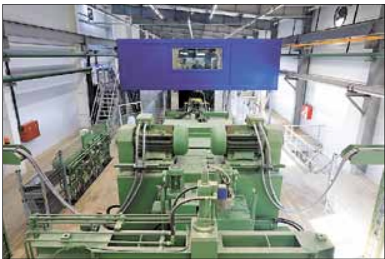
■ На ЛДК-3 используются самые современные перерабатывающие технологии

– Современное оборудование производства компаний Springer и Polytechnik, установленное на ЛДК-3,