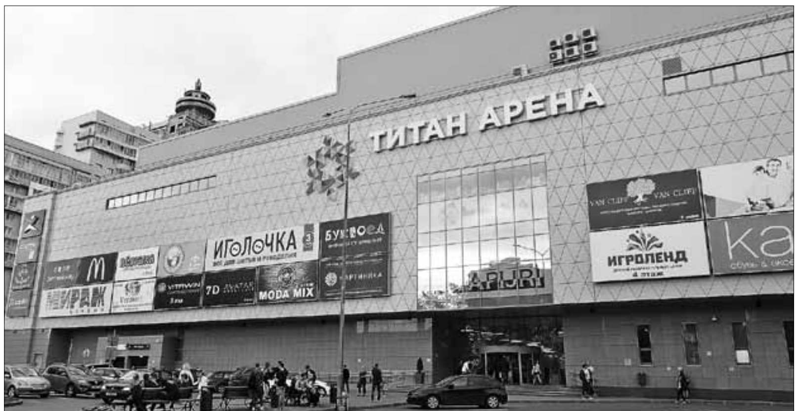
■ «Титан Арена» – не просто магазин, а еще и место отдыха и развлечений для всей семьи

– Помимо «Центрального универмага» в вашем управлении находятся магазин «Светлана», универсам «Олимп» в Новодвинске, которые можно смело назвать настоящими памятниками советской торговли, в них все