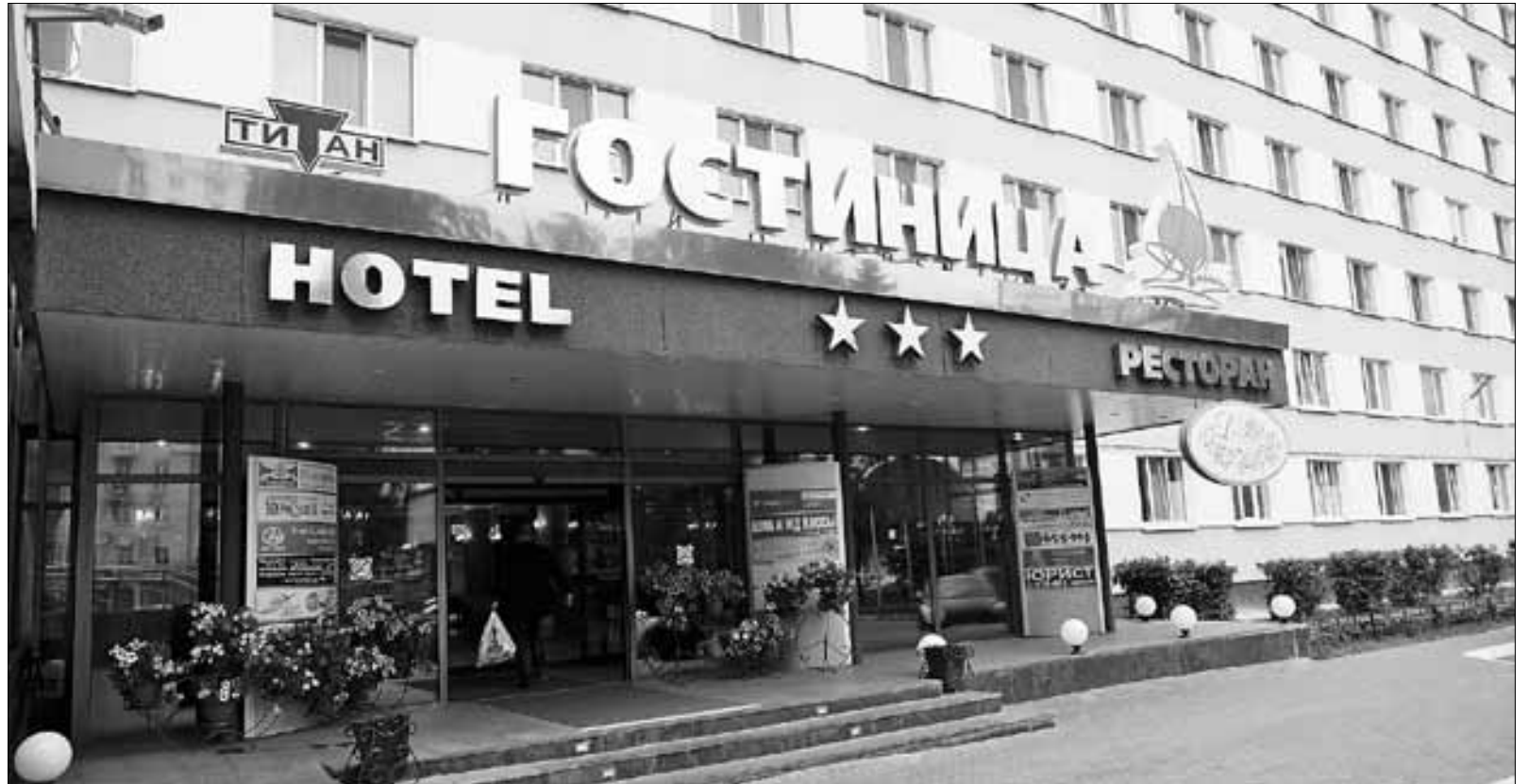
■ Гостиница «Двина»: творческий подход к оформлению номеров и разработка собственных стандартов качества обслуживания

– На сегодняшний день «Титан-Девелопмент» включает в себя управление одиннадцатью объектами коммерческой недвижимости. Шесть из них – это офисные центры и гостиница «Двина», пять торговых центров, включая ТРК «Титан Арена». Иными словами, мы являемся