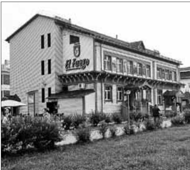
■ Офисный центр на пр. Чумбарова-Лучинского, 39

– Вы правы, но список этот далеко не полный. Мы, как и другие предприятия группы компаний «Титан», всегда стараемся поддерживать социальные проекты. Но для нас это еще и отличный способ привлечь покупателей, разнообразить их досуг. Например, мы уже реализовали ряд совместных проектов с известным историком и краеведом Юрием Барашковым. Посетители нашего торгово-раз-