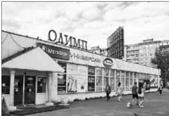
■ Магазин «Олимп» в Новодвинске

влекательного центра смогли познакомиться с выставкой «Старый Архангельск», экспозицией, посвященной юбилею прихода в Архангельск первого конвоя «Дервиш». Сейчас в галерее третьего этажа работает выставка «Архангельск. Кто где жил». Любопытно, что наши посетители очень позитивно воспринимают такие проекты – останавливаются, изучают, рассматривают старые фотографии. Мы же в свою