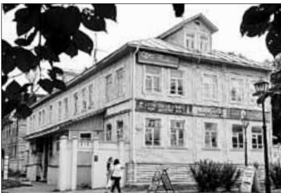
■ Офисный центр на пр. Чумбарова-Лучинского, 37