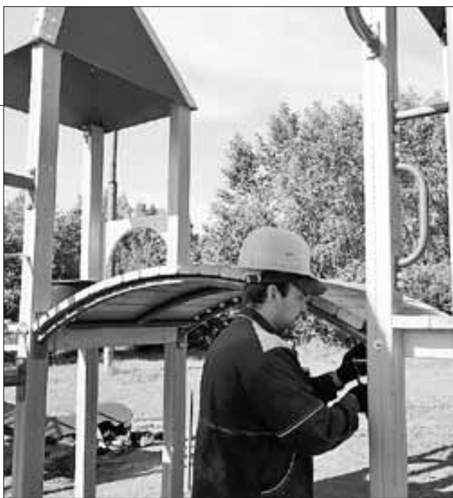
■ Идет демонтаж игровой площадки в Северном округе

« Город сильно заинтересован в дальнейшем получении средств на благоустройство. Поэтому у муниципалитета нет другого пути, кроме того, как тесно работать с подрядчиками и добиваться, чтобы все вопросы были решены в срок и работа сдана без нареканий