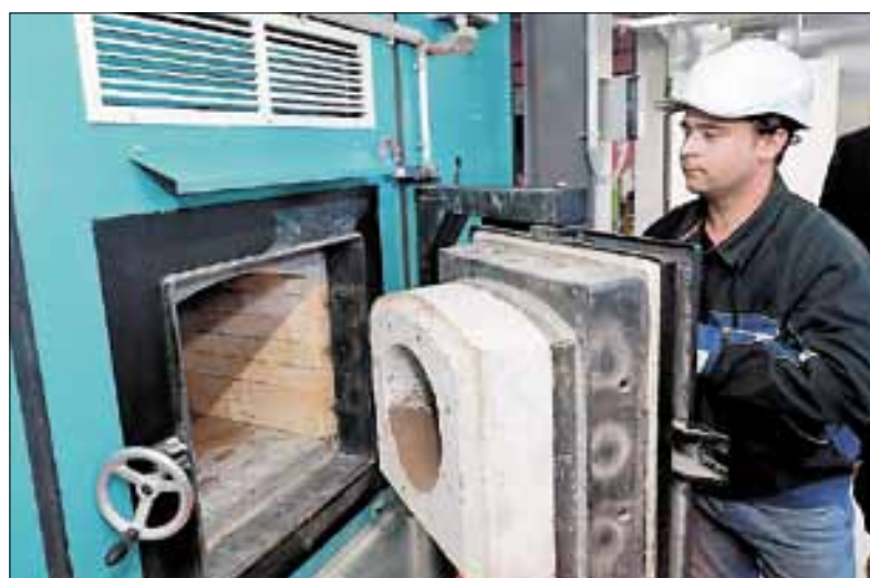
■ Новая заводская котельная работает на корддревесном сырье и безопасна для окружающей среды