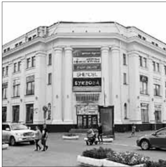
■ Центральный универмаг