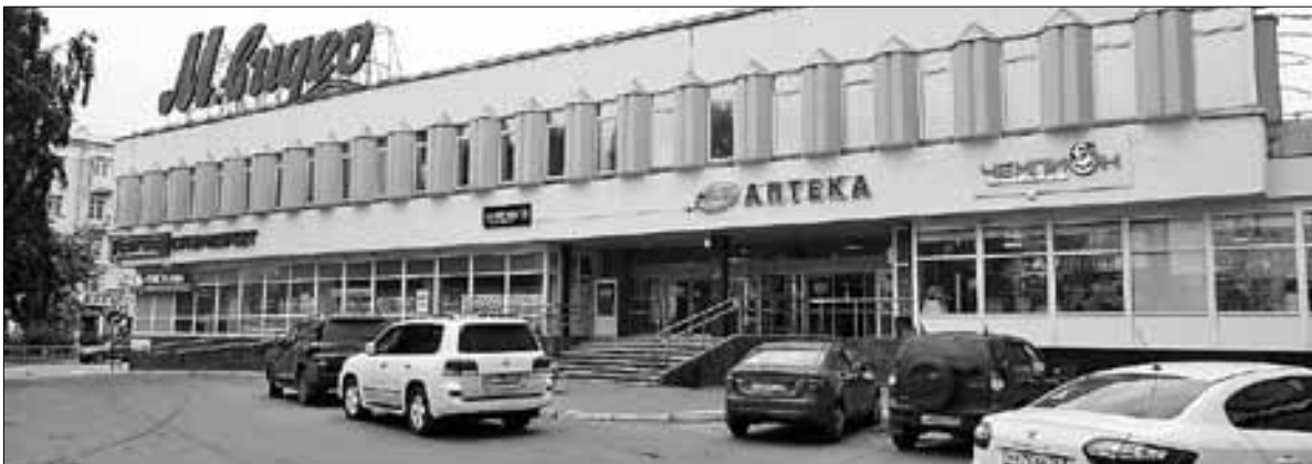
■ Торговый центр «Премьер»