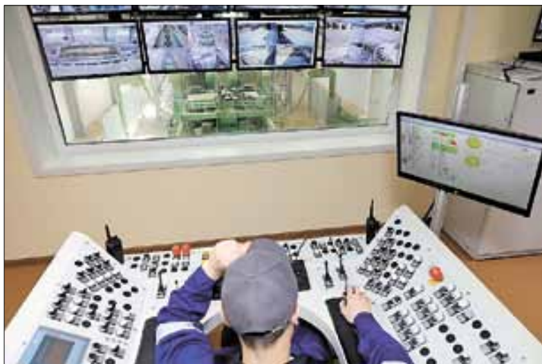
■ Автоматизация производства полностью исключает тяжелый ручной труд