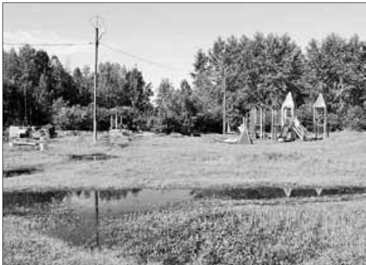
■ Так сейчас выглядит парковая территория у КЦ «Северный»