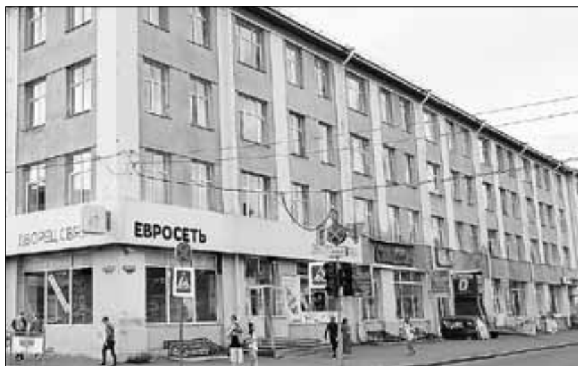
■ Магазин «Светлана»