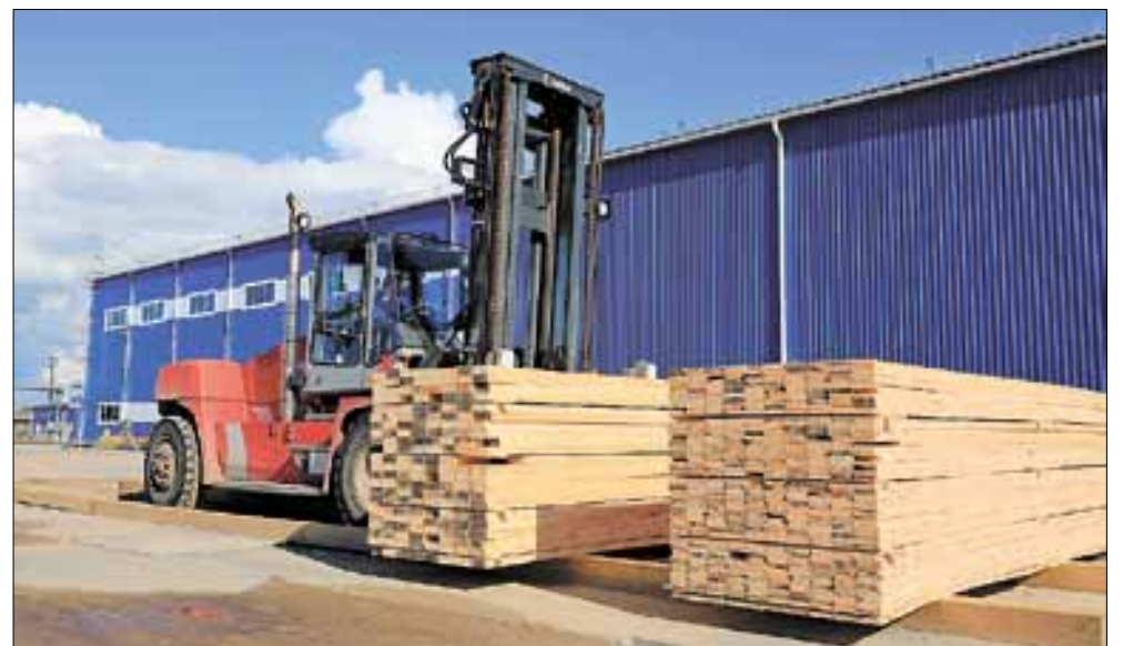
■ Вся производственная цепочка на предприятии обеспечивает высокий класс экологической безопасности