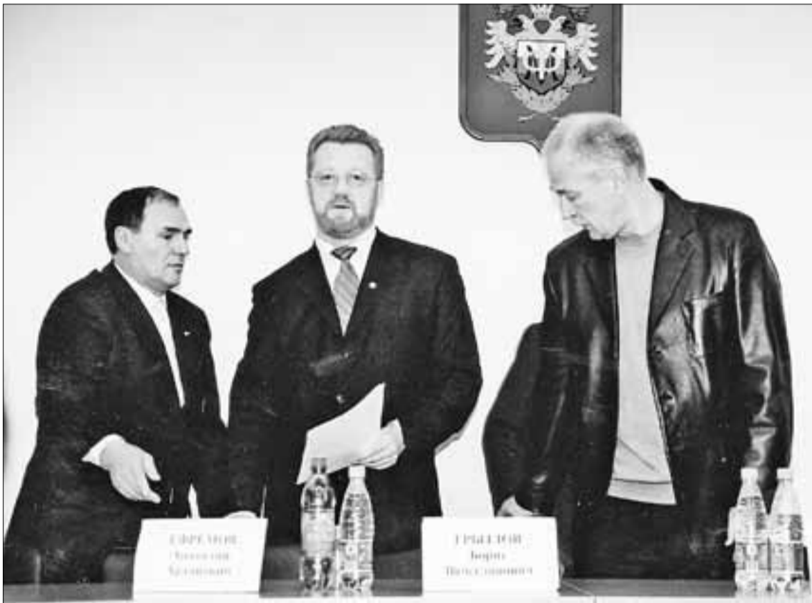
■ Визит в Архангельск председателя генсовета «Единой России» Бориса Грызлова

Один из больших проектов фонда – строительство телевышки. На тот момент была идея покрыть телевизионным сигналом всю область. Даже создавались мини-студии в районах для обратной связи. Тогда очень трудно было найти деньги на ее строительство, и фонд одним из первых сделал взнос на ее проектирование.