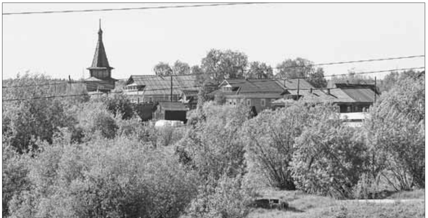
■ Храм стал украшением и духовным центром Тойнокурья.