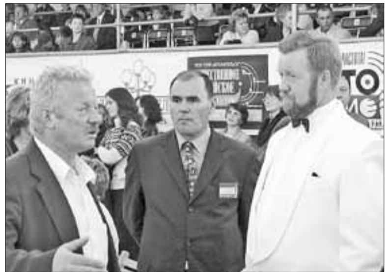
■ На кинофестивале «Сполохи»