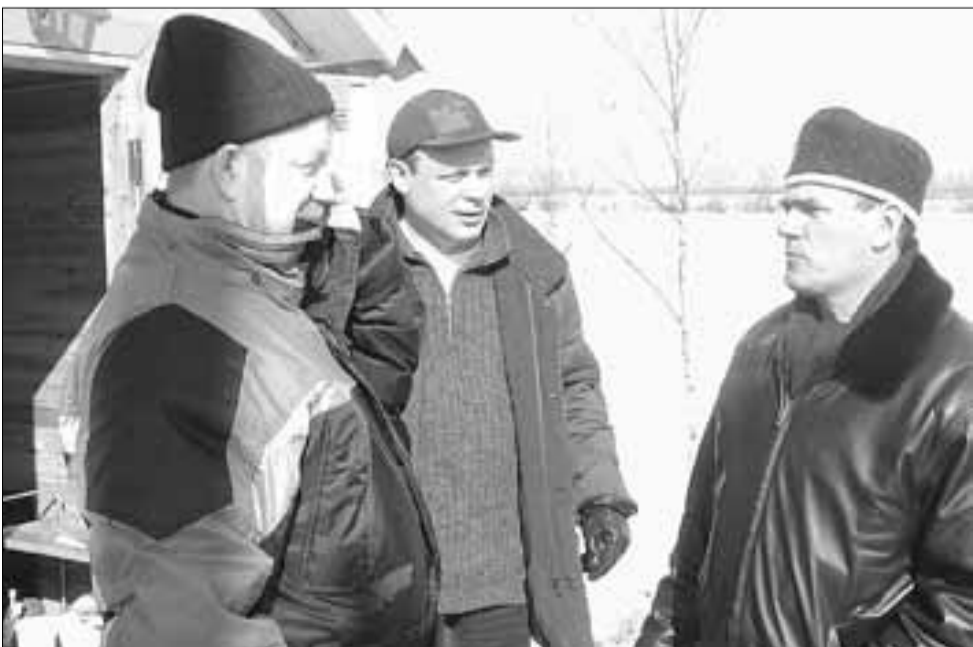
■ Сергей Жигунов и Евгений Шевчук в гостях у Ефремова в Тойнокурье