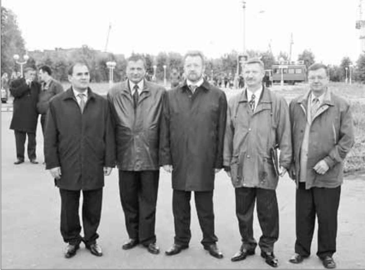
■ Во время рабочей поездки губернатора на «Красную Кузницу»

и стоял у истоков формирования партийного движения в Архангельске и области