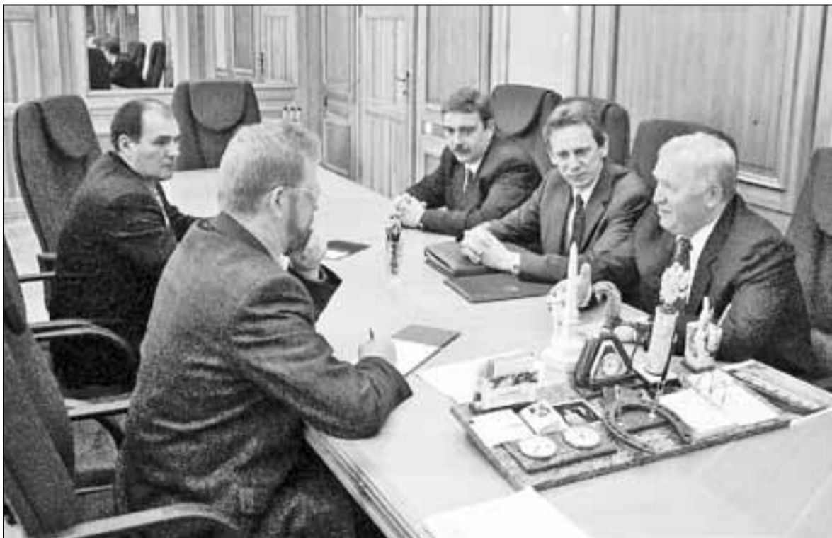
■ Встреча с генеральным секретарем партии «Единая Россия» Валерием Богомоловым в кабинете губернатора

Поэтому Ефремову было очень сложно психологически, когда его бывшие соратники, единомышленники, с которыми вместе пережили трудные моменты, вдруг оказались в противоположном лагере. Так что выборную кампанию 2000 года легкой не назовешь. Тем не менее мы выиграли.