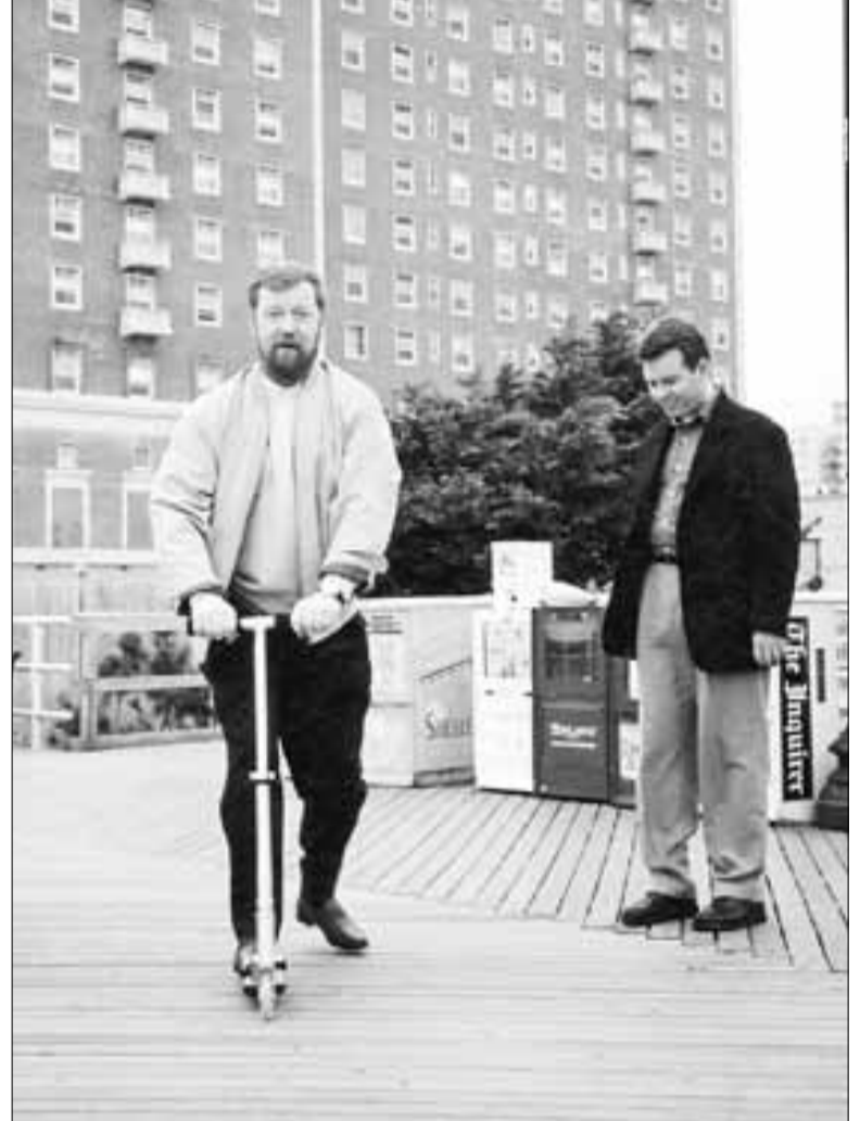
■ В Атлантик-Сити глава официальной делегации Совета Федерации катался на самокате