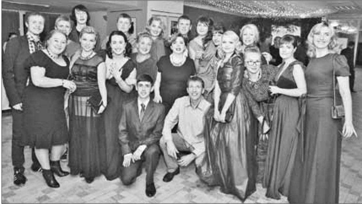
■ Коллектив «АТК-Медиа» на праздничном вечере.

Архангельской телевизионной компании исполнилось 25 лет, а городскому телевидению – 15