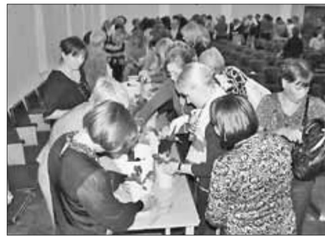
■ После собрания дети и взрослые посадили цветы

– Особое внимание уделяется одному из самых важных видов деятельности нашего учреждения – экологическому образованию и просвещению. Наша работа направлена на пропаганду экологических и природоохранных знаний, повышение уровня экологической культуры общества, формирование самосознания школьников и населения города и области, а также на повыше-