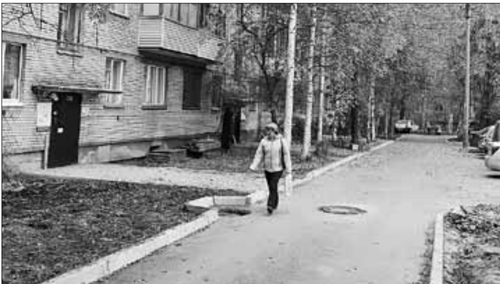
■ Улица Шубина, 20.

– Шесть дворов Маймаксанского округа попали в новую федеральную программу, на их благоустройство было выделено почти 3,7 миллиона рублей. Жители предпочли ограничиться лишь ремонтом проездов и тротуаров, поскольку условия проекта предполагают деятельное участие собственников жилых помещений. Безусловно, хотелось бы видеть в наших дворах не только ровные дороги и удобные тротуары, но и обновленные детские площад-