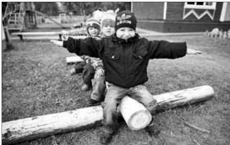
■ Воспитанники гуляют во дворе детсада.

– Общая сумма контрактов в детском саду № 123 составила три миллиона 200 тысяч рублей. Также в рамках целевой субсидии учреждению направлены денежные средства для разработки проектно-сметного решения по дополнительным видам работ: установке вентиляции; замене инженерных комму-