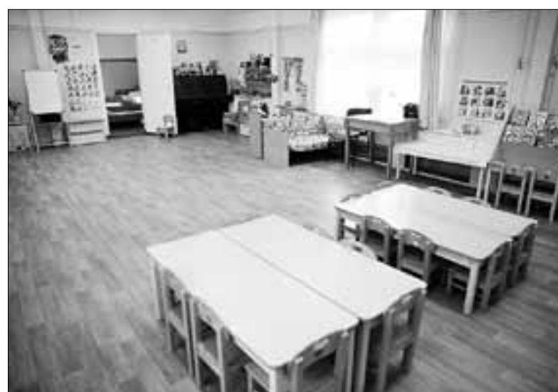
■ Отремонтированное помещение новой группы.

В этом учебном году в детские сады Архангельска зачислены 4 524 ребенка в возрасте от 1,5 до 7 лет. Общее количество детей, пользующихся услугой дошкольного образования, составляет 19 227 человек, из них в возрасте от 1,5 до 3 лет – 2 370 человек. Все дети от трех до семи лет устроены в садики. На очереди в детсад стоят 9 024 ребенка в возрасте от полутора до трех лет.