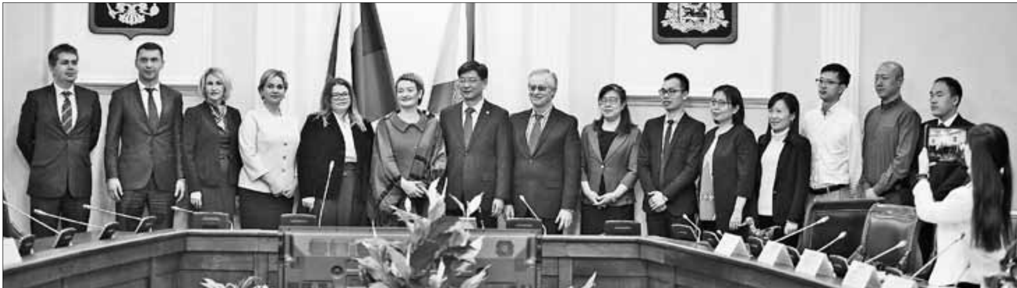
■ Встреча с китайской делегацией в правительстве Архангельской области.

Новый подход: В Архангельске обсудили планы сотрудничества с КНР в сфере туризма