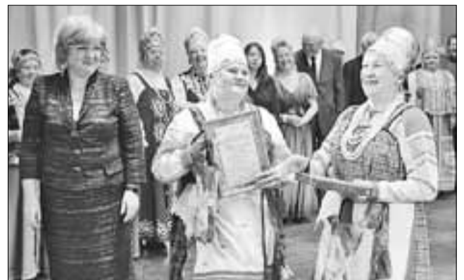
■ Фольклорный ансамбль «Церемоночка» – лауреат конкурса «Песня – верный друг наш навсегда»