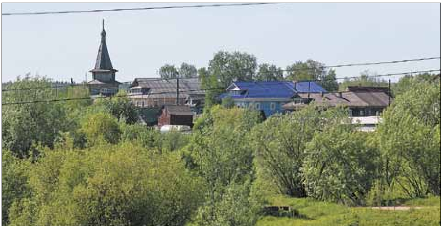
■ Храм стал украшением и духовным центром Тойнокурья.