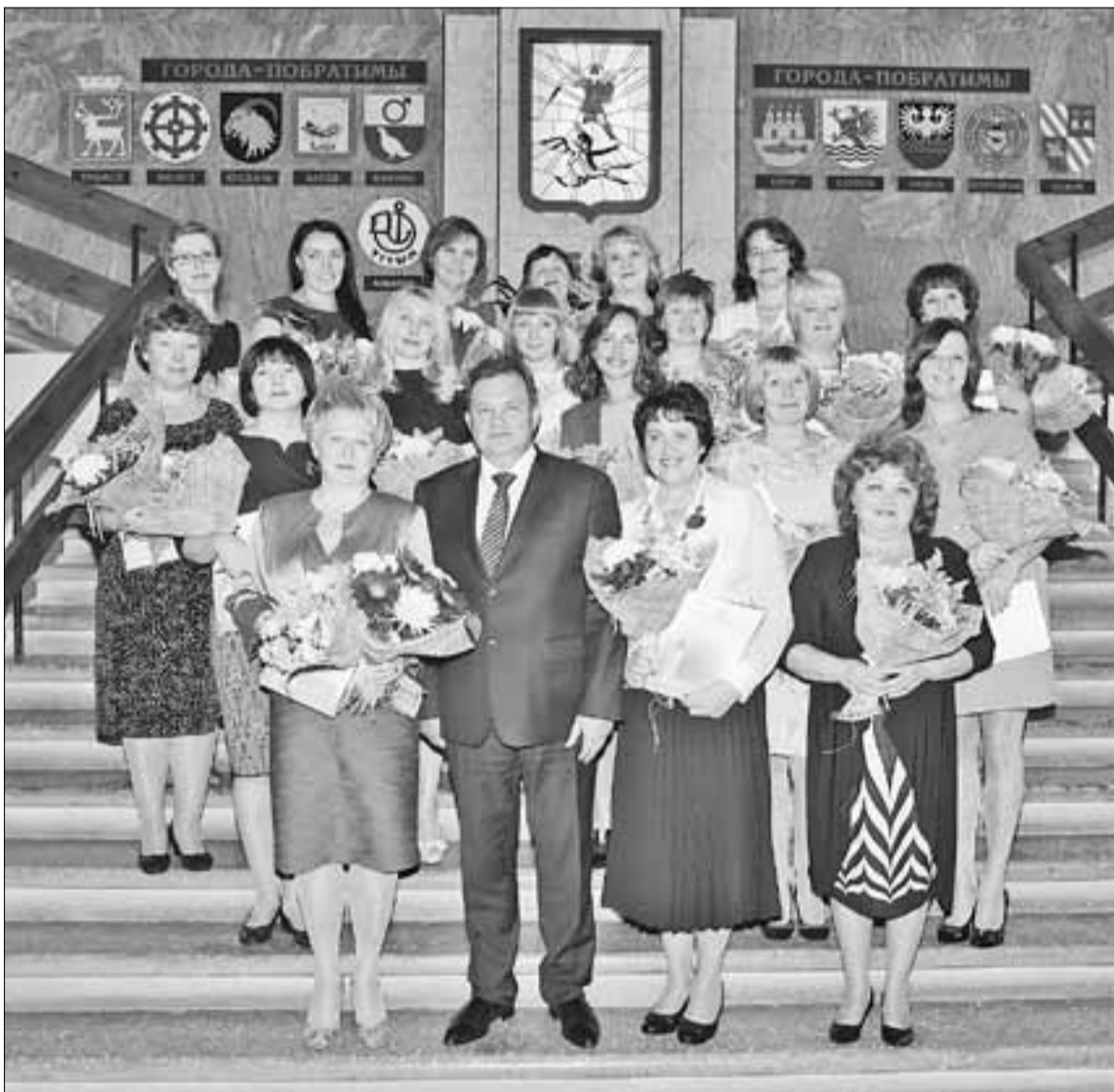
■ Лучшие педагоги Архангельска – обладатели премии мэра.

– Мы каждый день помогаем детям найти себя, совершить первое и, может быть, самое важное открытие – открыть в себе свой талант. И такие конкурсы помогают посмотреть на себя со стороны, стимулируют поиск новых педагогических идей, образовательных технологий. Поэтому огромное спасибо за организацию этого