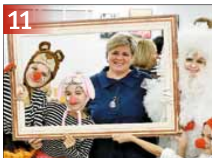
11 Накануне Дня учителя в Архангельске чествовали работников системы образования