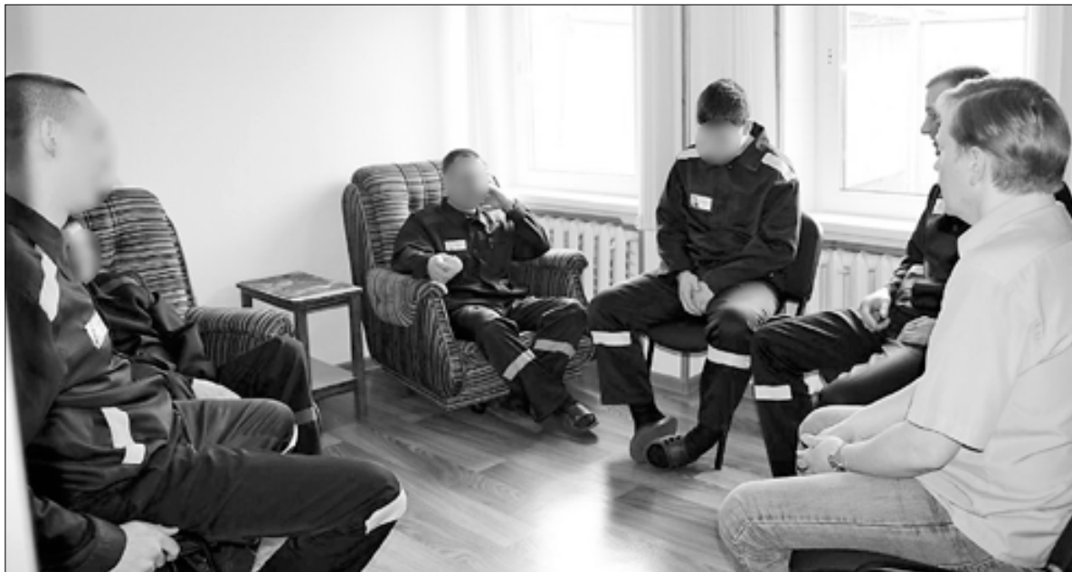
■ В основе программы – групповая психотерапия

– Это уже не те люди, которых называют зеками в самом негативном смысле этого слова: недоверчивые, заикливые, на получении выгоды. Возможно, сюда они приходят такими, но, участвуя в работе, становятся более социа-