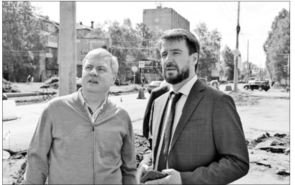
■ МУП «Горсвет» заменило вдоль проспекта Ломоносова 40 аварийных опор, еще 19 выправило по вертикали. Установлено более 100 современных светодиодных светильников