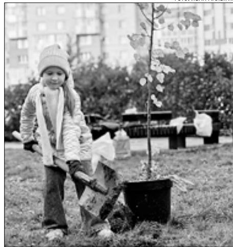
■ ФОТО: ИВАН МАЛЫГИН