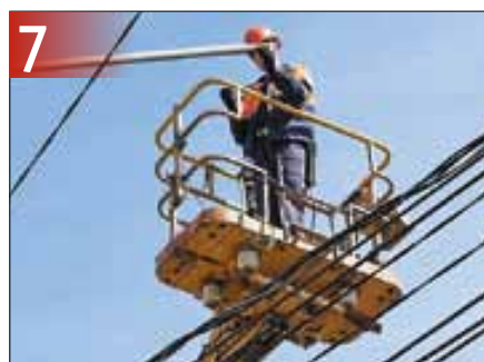
7 МУП «Горсвет» продолжает работу по повышению уровня освещенности улиц и дворов

Подписывайтесь на нас в социальных сетях и будьте в курсе всего, что происходит в городе!