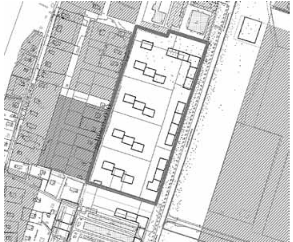
СХЕМА границ проектирования

Приложение к техническому заданию на подготовку проекта планировки территории муниципального образования "Город Архангельск" в границах ул. Капитана Хромцова площадью 5,6183 га