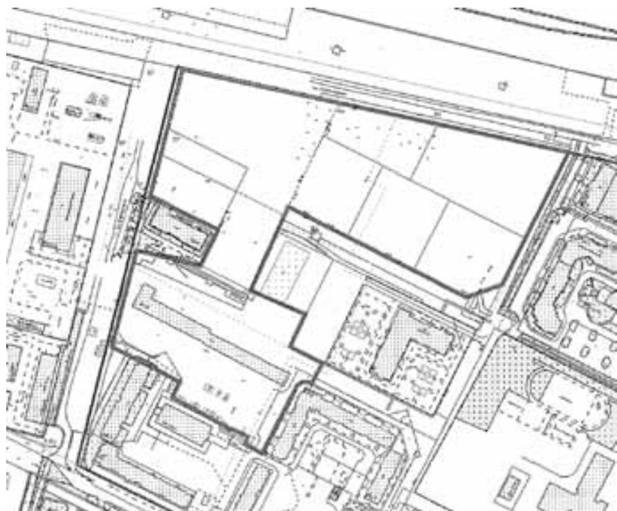
СХЕМА границ проектирования

Приложение к техническому заданию на подготовку проекта межевания территории муниципального образования "Город Архангельск" в границах ул. Стрелковой и ул. Карпогорской площадью 6,1824 га