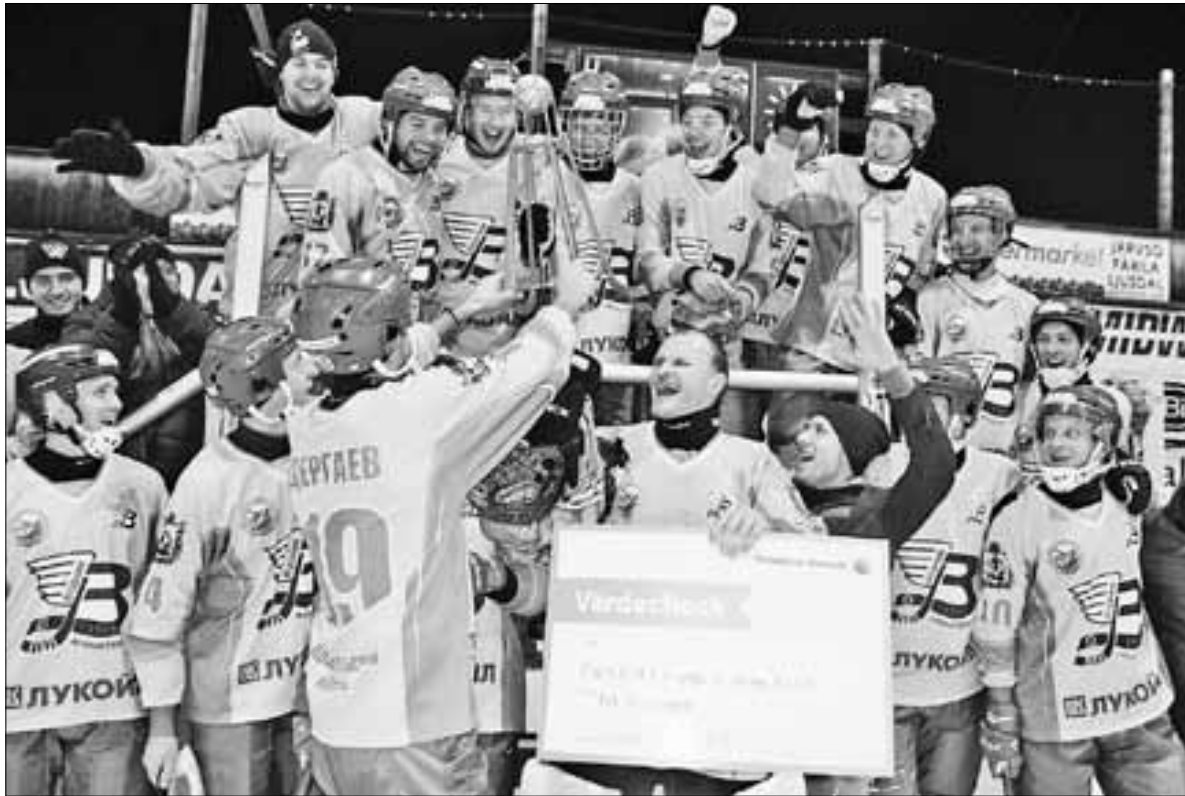
■ «Водник» – триумфатор «ЕхТе Сиреп».

Строить прогнозы на кубковые матчи в «Крылатском» – дело благодарное. В русском хоккее, как и в любом другом игровом виде спорта, может случиться всякое. Удивляет, правда, один факт. Через день после финала хоккеисты «Динамо» и «Водника» проведут свои стартовые поединки чемпионата России в Нижнем Новгороде и Архангельске соответственно. А вот «Енисей» и «СКА-Нефтяник» почему-то начнут главный турнир сезона только во втором туре, который состоится 8 ноября. Что ж, руководству Федерации хоккея с мячом России, как