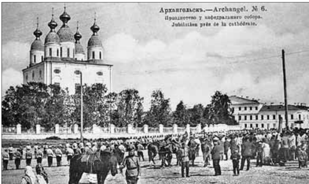
■ Архангельск глазами Якова Лейцингера