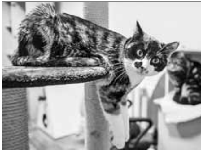
■ Гагаринка с улицы Гагарина