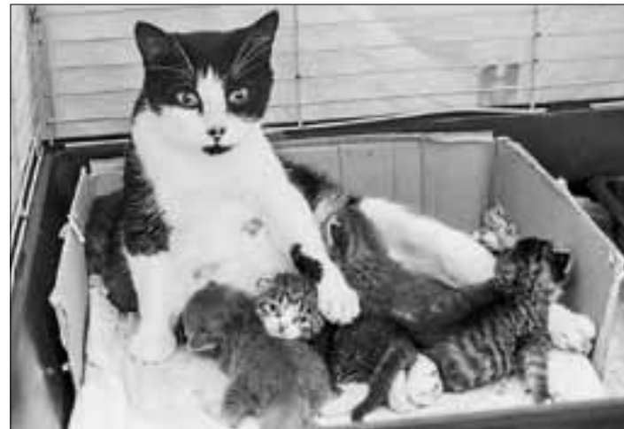
■ Кошка Малышка – молодая мама