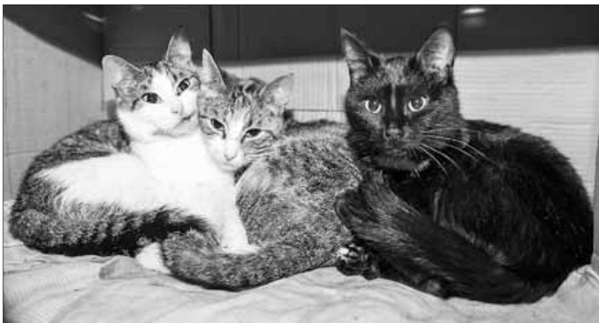
■ Малая родина Тоси, Нюси и Сени – Соловки. Оттуда прилетела их мама Алиса

Мишаня тоже не местный, его привезли из Новодвинска: из-за перенесенной инфекции кот теперь