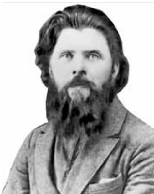
■ Василий Александрович Горохов , первый директор АЛТИ с 1929 по 1937 год.

День памяти жертв политических репрессий: в Музее истории САФУ составляют поименный список тех, кто невинно пострадал в 30-50-е годы прошлого века