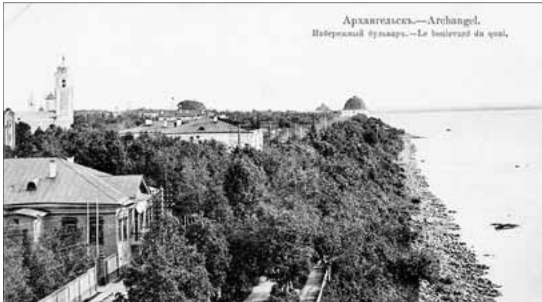
■ Старый город