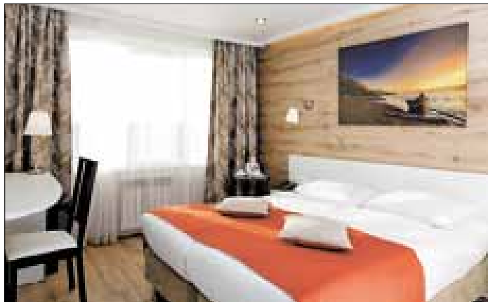
■ Современные номера сделаны в разных дизайнерских стилях