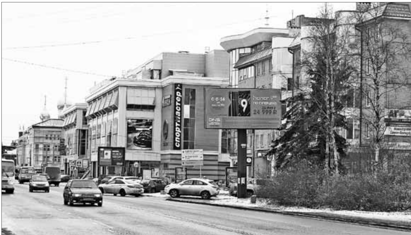
■ Одними из основных плательщиков налога на недвижимость станут владельцы торговых центров.

– Я знаю, что законопроект о введении налога на недвижимость прошел очень серьезные обсуждения в региональном пар-