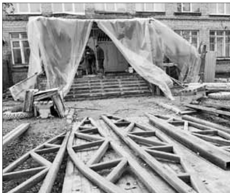
■ В школе № 48 ремонтируется крыльцо центрального входа в здание

■ В медпункте на Хабарке ежедневно ведет прием взрослого и детского населения фельдшер