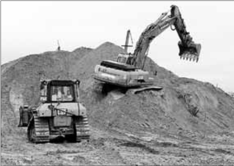
■ Серьезные монтажные работы на причале запланированы именно на текущий год

Глава Архангельска Игорь Годзиш проверил объекты транспортной и социальной инфраструктуры на островной территории