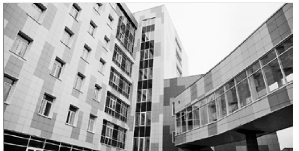
■ В настоящее время в перинатальном центре завершается благоустройство, коробка здания готова, тепловой контур закрыт.

– Мы ожидаем, что в следующем году инвестиции принесут дополнительный доход в бюджет и, как следствие, предоставят дополнительные возможности для решения социальных задач, – сказал Игорь Орлов .