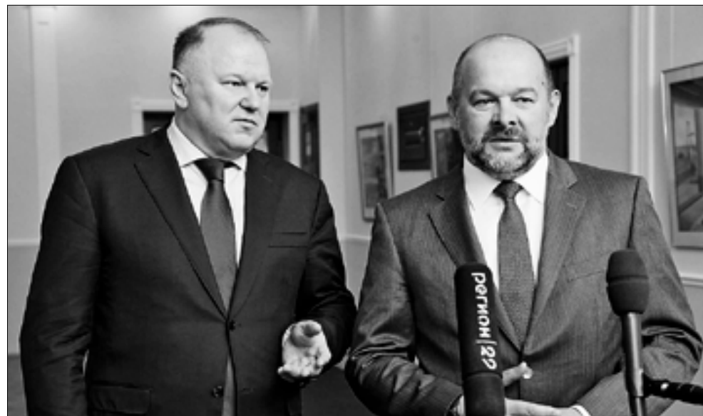
■ Николай Цуканов и Игорь Орлов.

Это важно: В Архангельске с рабочим визитом побывал полномочный представитель Президента РФ в СЗФО Николай Цуканов