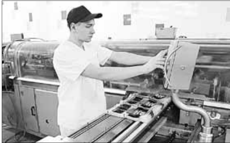
■ За последние несколько лет были модернизированы все производственные процессы.

Сегодня «Архангельскхлеб» – это два хлебозавода и автотранспорт-