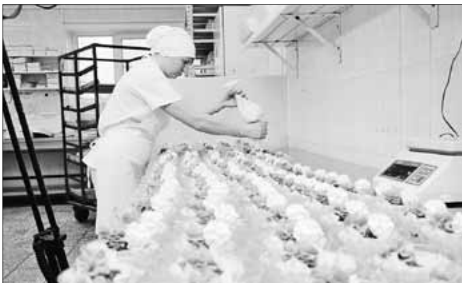
■ «Сладкая работа» в кондитерском цехе.