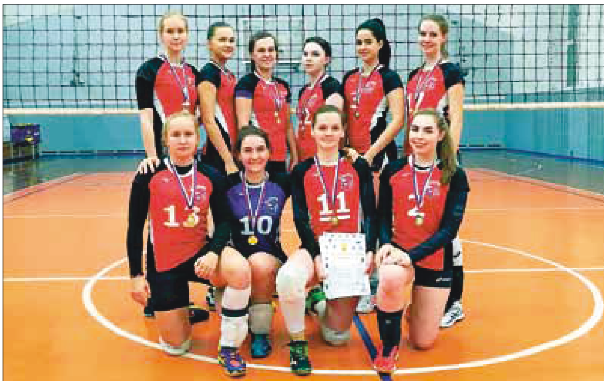
■ На снимке: «Каравелла» – чемпион Архангельска 2019 г. и фаворит Кубка области по волейболу.

В ближайшее время на лед выйдут команды из Северодвинска и «Юность» из Плесецка. Между тем завершился первый этап чемпионата области по мини-хоккею. На льду крытого модуля стадиона «Труд» за девять путевок во второй этап турнира, который пройдет в апреле будущего года, сражались 15 команд. Все они были разбиты на три группы по пять в каждой. Три лучших хоккейных дружины из каждой выходили в следующий раунд. По итогам группового турнира право выступить в решающем втором этапе чемпионата завоевали архангельские «Портовик», «Северная Двина», «Сириус», «Помор», «Водник-2002», «Водник-2003», «Водник-2004», а также северодвинский «Севмаш» и плесецкая «Юность». Интересно, что только хоккеисты «Портовика» и «Северной Двины» не потеряли ни одного очка на первом этапе. Остальные коллективы