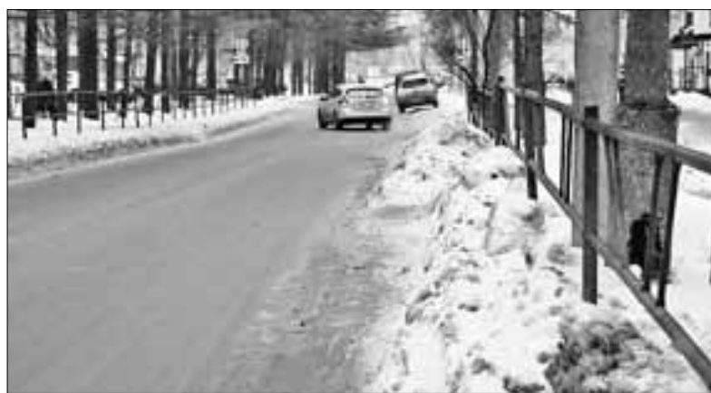
■ Улица Суворова

скими «лапами» и тут же по транспортеру отправляла его в кузов грузовика.