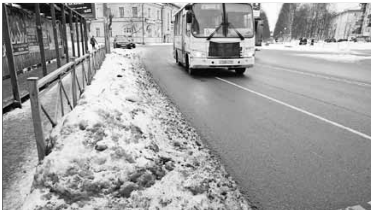
■ Троицкий проспект в районе пересечения с улицей Суворова

Тут невольно вспомнишь старую-добрую спецтехнику, которая специально подбирала сметенный с проезжей части снег механиче-