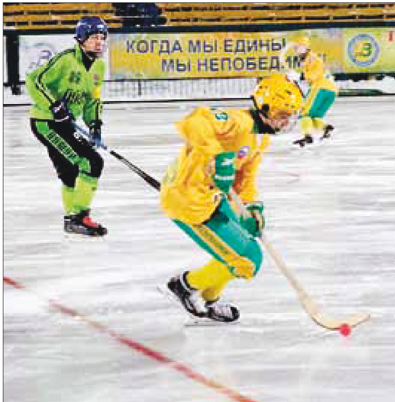
■ На льду «Водник-2004» и «Помор».

поборются за места с 10 по 15-е. Ими стали «Атлант» и «Лесопильщик» из Архангельска, «Северодвинск», «Алмаз» и «Ладога» из города корабелов, «Юность-1» из Плесецка.