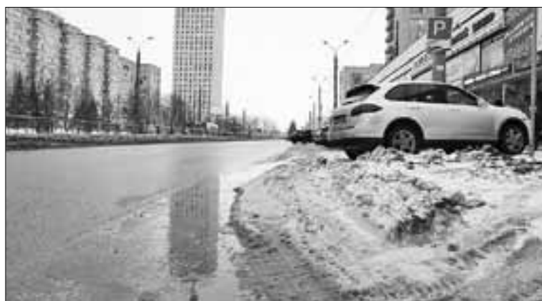
■ Улица Воскресенская, центр города