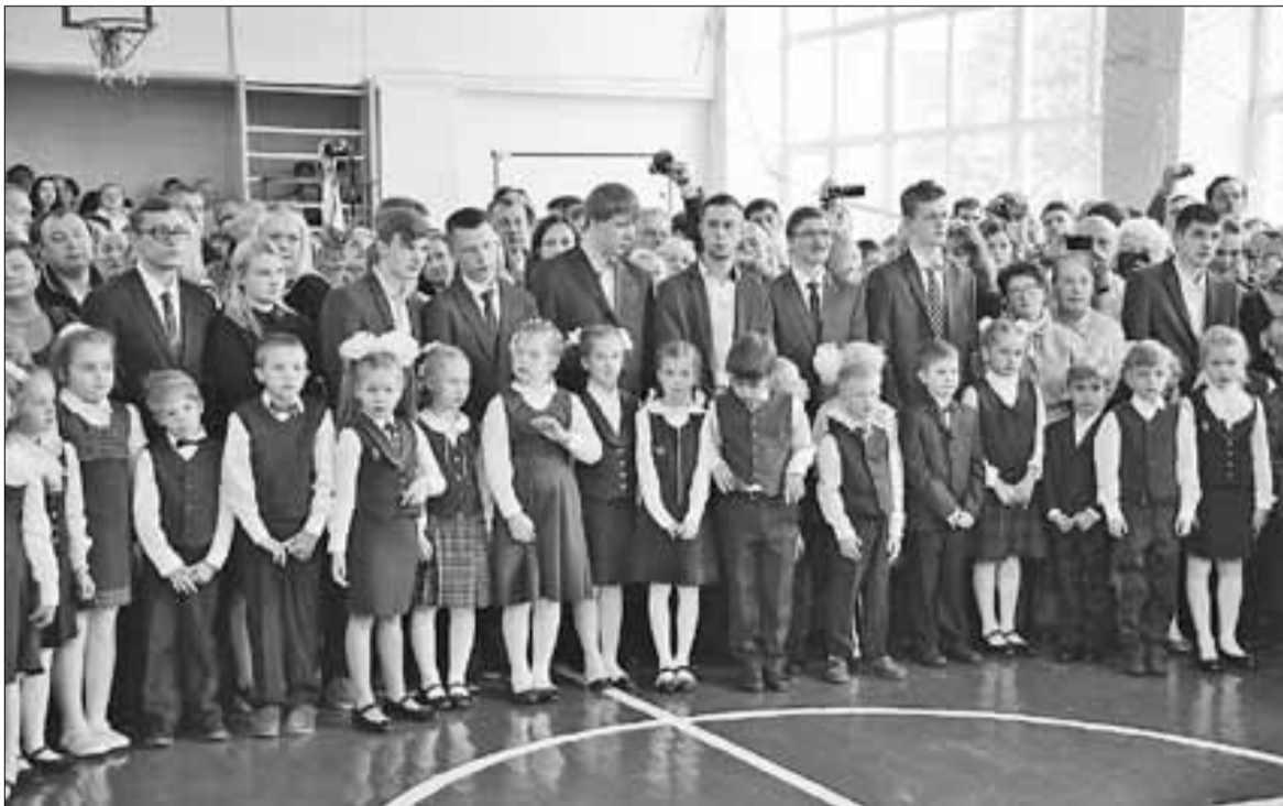
■ На линейке первоклашек приветствовали старшеклассники, педагоги и родители.

– Прошло много лет, как я сам учился в школе, но дети все такие