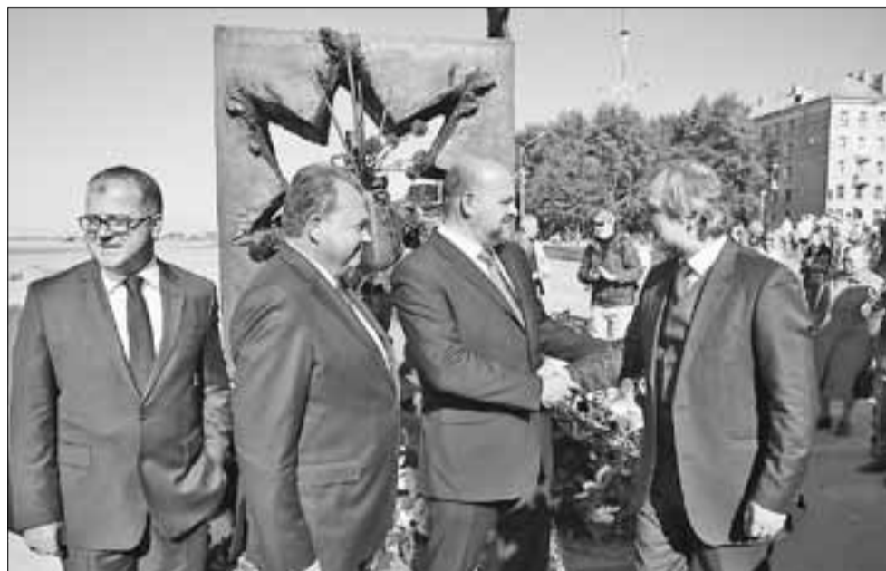
■ Генконсул Великобритании в Санкт-Петербурге Аллан Кит Ренни, мэр Архангельска Виктор Павленко, глава региона Игорь Орлов и Чрезвычайный и Полномочный Посол Великобритании в России Тим Барроу.