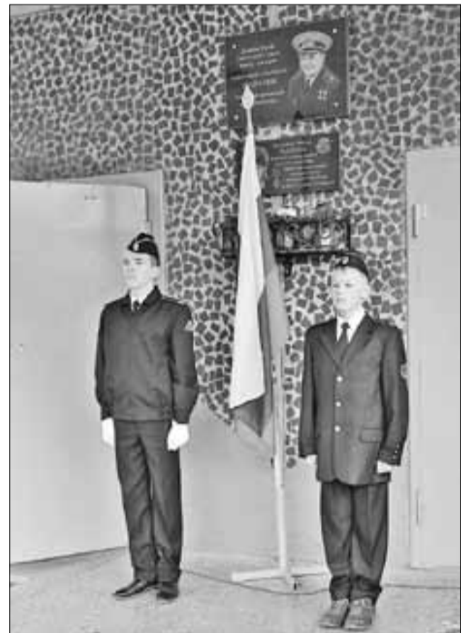
■ Школа № 50 носит имя дважды Героя Советского Союза Александра Шабалина.