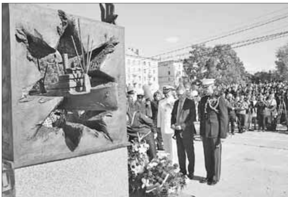
■ Генконсул США в Санкт-Петербурге Томас М. Лири возлагает цветы к памятнику.

В праздничных мероприятиях «Дервиш-2015» приняли участие представители ветеранских организаций